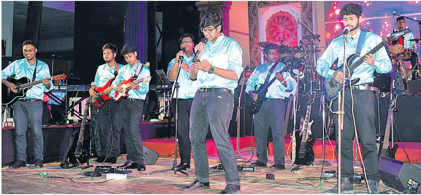
ଭୁବନେଶ୍ୱର ରବୀନ୍ଦ୍ର ମଞ୍ଚପାଠରେ ସୋମବାର ଅନୁଷ୍ଠିତ 'ଦି ଆଭିସ୍ ସ୍କୁଲ ଅଫ୍ ମ୍ୟୁଜିକ୍'ର ଆନୁଷ୍ଠାନିକ କନ୍ସର୍ଟ-୨୦୧୮ରେ ସଙ୍ଗୀତ ପରିବେଷଣ କରାଯାଇଛି।