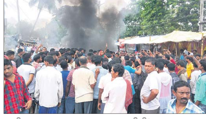
ବେଗୁନିଆ ଛକଠାରେ ଉଭୟକ୍ଷେତ୍ର ଲୋକେ ରାସ୍ତାରୋକୋ କରିଛନ୍ତି।