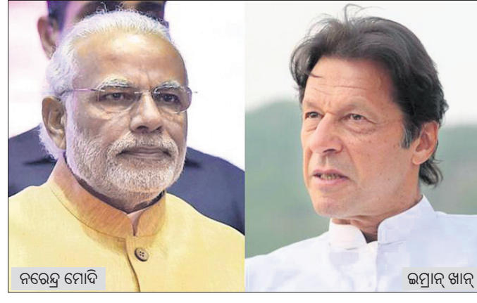
ନରେନ୍ଦ୍ର ମୋଦି ଇମ୍ରାନ ଖାନ୍

କ୍ରିକେଟରରୁ ରାଜନେତା ସାଜିଥିବା ଇମ୍ରାନ ଖାନ୍ ପାକିସ୍ତାନର ଶାସନ ମଙ୍ଗ ଧରିବା ପରେ ପଡ଼ୋଶୀ ଭାରତ ସହ ଏହାର ସମ୍ପର୍କକୁ ନେଇ ଚର୍ଚ୍ଚା । ତିରୁତା ଦୂର ଲାଗି ନୂଆ ପ୍ରଧାନମନ୍ତ୍ରୀ କେଉଁ ପଦକ୍ଷେପ ନେଉଛନ୍ତି, ତା ଉପରେ ସଭିଙ୍କ ନଜର । କିନ୍ତୁ ଆରମ୍ଭରୁ ସୃଷ୍ଟି ହେଲାଣି ବିବାଦ । ପାକିସ୍ତାନ ସହ ଭାରତ ଗଠନମୂଳକ ସମ୍ପର୍କ ଚାହୁଁଥିବା ପ୍ରଧାନମନ୍ତ୍ରୀ ନରେନ୍ଦ୍ର ମୋଦି ପ୍ରତିପକ୍ଷ ଇମ୍ରାନଙ୍କୁ ଚିଠି ଲେଖିଛନ୍ତି । ସରକାରୀ ସୂତ୍ରରୁ ଏହା ଜଣାପଡ଼ିଥିବା ଜାତୀୟସ୍ତରର ଗଣମାଧ୍ୟମରେ ପ୍ରକାଶ ପାଇଛି । କିନ୍ତୁ ପାକିସ୍ତାନ ସୁ-ଚର୍ଚ୍ଚା ମାଗିବା ସହ ଦୂର ଦୂରନ୍ତରେ ଏହାକୁ ଖଣ୍ଡନ କରିଛି । ଦ୍ୱିପକ୍ଷିକ ଆଲୋଚନା ପାଇଁ ମୋଦି ଚିଠିରେ ପ୍ରସ୍ତାବ ଦେଇ ନାହାନ୍ତି ବୋଲି ପାକିସ୍ତାନ ବୈଦେଶିକ ମନ୍ତ୍ରଣାଳୟର ଜଣେ ମୁଖ୍ୟପାତ୍ର କହିଛନ୍ତି । ବିଭିନ୍ନ ବିବାଦର ସମାଧାନ ଲାଗି ନୂଆଦିଲ୍ଲୀ ସହ ଇସ୍ଲାମାବାଦ ନିରନ୍ତର ଆଲୋଚନା ଚାହୁଁଛି ବୋଲି ସୋମବାର ପାକିସ୍ତାନର ନୂଆ ବୈଦେଶିକ ମନ୍ତ୍ରୀ ଶାହ ମହମ୍ମଦ କୁରୁରେଣି କହିଛନ୍ତି ।