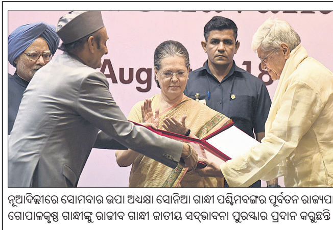
ନୂଆଦିଲ୍ଲୀରେ ସୋମବାର ଉପା ଅଧ୍ୟକ୍ଷା ସୋନିଆ ଗାନ୍ଧୀ ପଶ୍ଚିମବଙ୍ଗର ପୂର୍ବତନ ରାଜ୍ୟପାଳ ଗୋପାଳକୃଷ୍ଣ ଗାନ୍ଧୀଙ୍କୁ ରାଜୀବ ଗାନ୍ଧୀ ଜାତୀୟ ସଦ୍‌ବାଚନା ପୁରସ୍କାର ପ୍ରଦାନ କରୁଛନ୍ତି ।

ନୂଆଦିଲ୍ଲୀ, ୨୦୧୮ (ପି.ଟି.)-ପୂର୍ବତନ ପ୍ରଧାନମନ୍ତ୍ରୀ ରାଜୀବ ଗାନ୍ଧୀଙ୍କ ୭୪ତମ ଜନ୍ମଦିନ ସୋମବାର ପାଳିତ ହୋଇଛି । ପ୍ରଧାନମନ୍ତ୍ରୀ ନରେନ୍ଦ୍ର ମୋଦି, କଂଗ୍ରେସ ମୁଖ୍ୟ ରାହୁଲ ଗାନ୍ଧୀ ଓ ବିଭିନ୍ନ ଦଳର ନେତାମାନେ ତାଙ୍କୁ ଶ୍ରଦ୍ଧାଞ୍ଜଳି ଜଣାଇଛନ୍ତି । ଦେଶ ପାଇଁ ତାଙ୍କ ଅବଦାନକୁ ସଭିଏଁ ମନେପକାଇଛନ୍ତି । ଦିଲ୍ଲୀରେ ଥିବା ରାଜୀବଙ୍କ ସମାଧିପାଠ ବାରଭୂମିରେ ପୂର୍ବତନ ରାଷ୍ଟ୍ରପତି ପ୍ରଣବ ମୁଖାର୍ଜୀ, ଉପା ଅଧ୍ୟକ୍ଷା ସୋନିଆ ଗାନ୍ଧୀ, କଂଗ୍ରେସ ଅଧ୍ୟକ୍ଷ ରାହୁଲ ଓ ଦକ୍ଷିଣ ନେତୃତ୍ୱ ଶ୍ରଦ୍ଧାସୁମନ ଅର୍ପଣ କରିଛନ୍ତି । ରାଜୀବଙ୍କ ଝିଅ ପ୍ରିୟଙ୍କା ଗାନ୍ଧୀ ଭଦ୍ରା, କ୍ୱାର୍ଟର ଉପର ଭଦ୍ରା, ପୂର୍ବତନ କେନ୍ଦ୍ରମନ୍ତ୍ରୀ ମଣିଶଙ୍କର ଆୟାଜ ମଧ୍ୟ ଶ୍ରଦ୍ଧାଞ୍ଜଳି ଦେଇଛନ୍ତି । ଗୁଜରାଟ କରିଆରେ ମୋଦି ପୂର୍ବତନ ପ୍ରଧାନମନ୍ତ୍ରୀଙ୍କ ଶ୍ରୁତିଚରଣ କରିଛନ୍ତି । ଦେଶ ପାଇଁ ରାଜୀବଙ୍କ ଉଦ୍ୟମ ସ୍ମରଣୀୟ ବୋଲି ସେ କୁହୁଛନ୍ତି ।