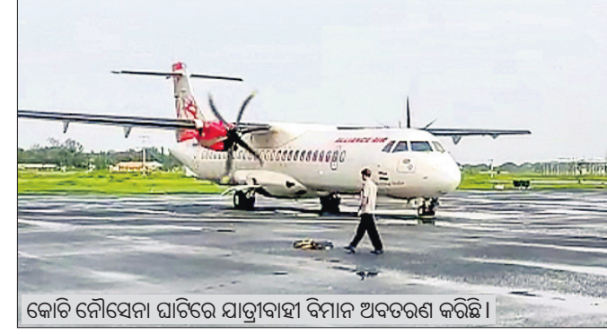
କୋଟି ନୌସେନା ଘାଟିରେ ଯାତ୍ରାବାହୀ ବିମାନ ଅବତରଣ କରିଛି ।