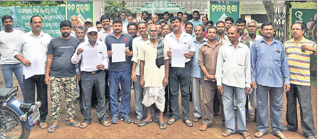
ଡିଏମ୍ସିକୁ ଦାବିପତ୍ର ପ୍ରଦାନ କରିବାକୁ ଆସିଥିବା ଗ୍ରାମବାସୀ।