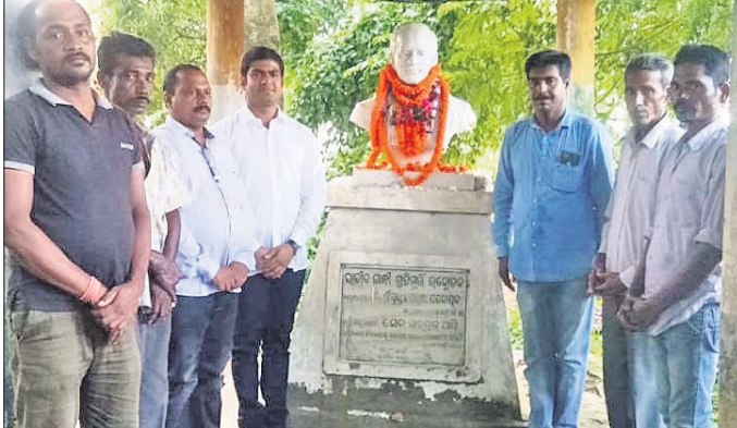
ମାହାଙ୍ଗାରେ ଅତିଥିମାନେ ରାଜୀବ ଗାନ୍ଧୀଙ୍କ ପ୍ରତିମୂର୍ତ୍ତିରେ ମାଲ୍ୟାପର୍ଣ୍ଣ କରୁଛନ୍ତି।