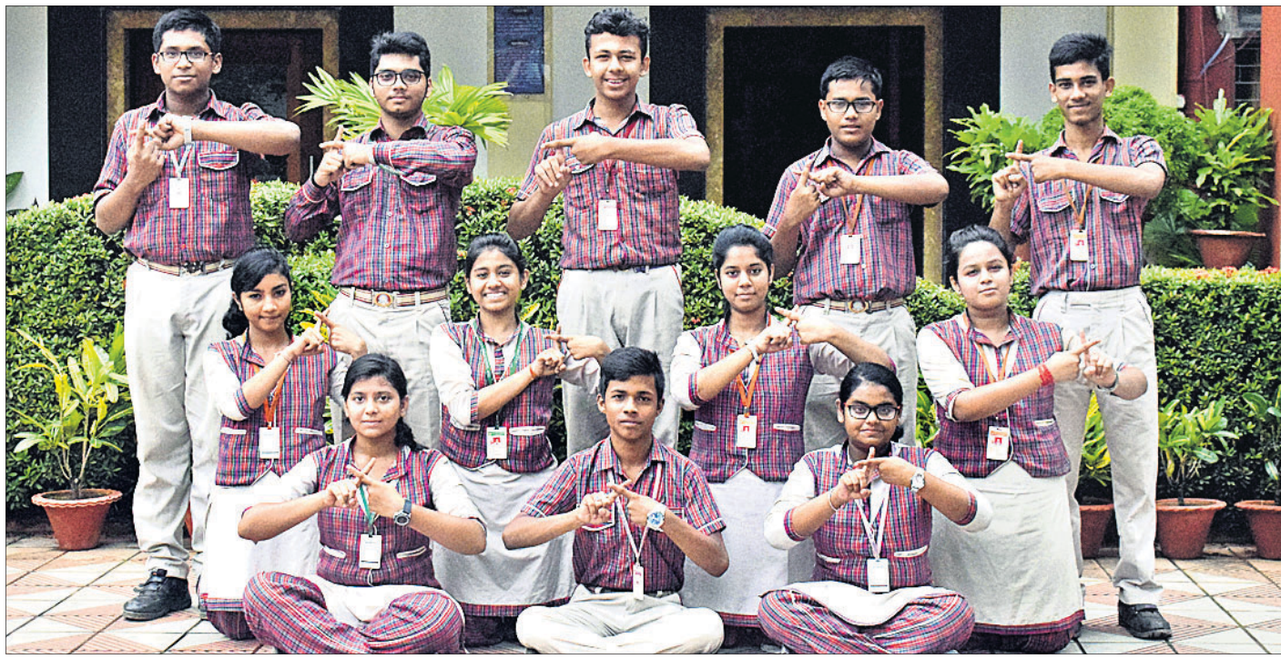
ଧରଣୀ ଓ ଓଡ଼ିଶା ପୋଲିସ୍ 'ପ୍ଲାଷ୍ଟିକ୍ ଫ୍ରୀ ଓଡ଼ିଶା' ଅଭିଯାନକୁ ସମର୍ଥନ ଜଣାଇଛନ୍ତି ଭୁବନେଶ୍ୱର କଳିଙ୍ଗନଗରସ୍ଥିତ ଡିଏଲ୍ ପବ୍ଲିକ୍ ସ୍କୁଲର ଛାତ୍ରାଛାତ୍ରୀମାନେ।