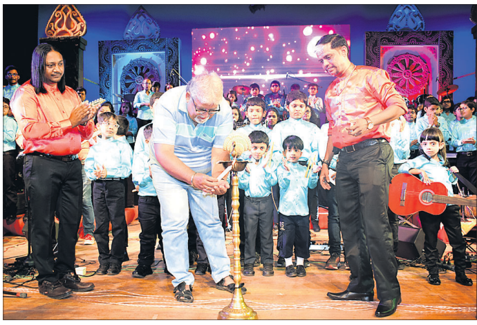
ଛାତ୍ରାଛାତ୍ରୀଙ୍କ ଗହଣରେ କାର୍ଯ୍ୟକ୍ରମକୁ ଅତିଥି ଉଦ୍‌ଘାଟନ କରୁଛନ୍ତି।

'ସେପ୍ ଅଫ୍ ୟୁ' ଆରମ୍ଭ କରି 'ଲଭ୍ ୟୁ ଲିଭେନ୍'। 'ଟପ୍ ଗର୍ଲ୍', 'ଗାରିଡ଼େସ୍ ଅଫ୍ ଫାୟାର୍' ଏବଂ 'ପାଇରେଟ୍ସ ଅଫ୍ ଦି କ୍ୟାବିନେଟ୍' ଭଳି ସିନେମାକୁ ଲୋକପ୍ରିୟ କୁଣ୍ଠାକାରୀ ଯୋଗେ 'ଟରକିସ୍ ମାର୍କି' ପର୍ଯ୍ୟନ୍ତ। ସେହିଭଳି 'ଅନ୍ ଲଗଲ୍ୟୁ ଡ୍ରେମ୍' ଏବଂ 'କ୍ୟାଲୋଲିୟା ଅଫ୍ ଦି ବେଲ୍'। ସୋମବାର ରବୀନ୍ଦ୍ର ମଞ୍ଚପାଠରେ ଏଭଳି ଜିନିଷାଦର ରକ୍ତ ଓ ପଦ୍ମ ଗୀତର ମଜାଦେଲେ ଭୁବନେଶ୍ୱର ଲୋକ। ଅବସର ଥିଲା ଭୁବନେଶ୍ୱରର ସର୍ବପୁରାତନ ବ୍ୟାଞ୍ଜ 'ଦି ଆଭିସ୍' ଦ୍ୱାରା ପ୍ରତିଷ୍ଠିତ 'ଦି ଆଭିସ୍ ସ୍କୁଲ ଅଫ୍ ମ୍ୟୁଜିକ୍' ପକ୍ଷରୁ ଆୟୋଜିତ ଏହାର ବାଣିଜ୍ୟ କନ୍ସର୍ଟ କାର୍ଯ୍ୟକ୍ରମ। ଓଡ଼ିଶାରେ ରକ୍ତ ଓ ପଦ୍ମ ପୁସ୍ତକ ସ୍କୁଲର ପ୍ରାୟ ୧୦୦ରୁ ଊର୍ଦ୍ଧ୍ୱ ଛାତ୍ରଛାତ୍ରୀ କନସର୍ଟରେ ଯୋଗେ, ଡୁଏର୍ ଏବଂ ଗ୍ରୁପ୍ରେ ଗୀତ ପରିବେଷଣ କରିଥିଲେ,