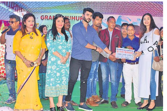
ଭୁବନେଶ୍ୱର ପ୍ରେସ୍ ଛକ ନିକଟ ଦଶିଶକାଳୀ ମନ୍ଦିର ପ୍ରାଙ୍ଗଣରେ ସୋମବାର ଓଡ଼ିଆ ଚଳଚ୍ଚିତ୍ର 'ବୁ ମୋ ଡ୍ରିମ୍‌ଲ୍ୟାଣ୍ଡ'ର ଶୁଭ ମହୁରତ ଅବସରରେ ଉପସ୍ଥିତ କଳାକାର ଓ ଅନ୍ୟମାନେ।