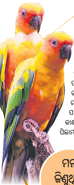
ମନ ଜିଣୁଥିବା ସ୍ଥାନ

ପକ୍ଷୀ ଦେଖିବା ପାଇଁ ନନ୍ଦନକାନନ ଜୈବ ଉଦ୍ୟାନରେ ୩ ସ୍ଥାନ ରହିଛି। ସେଥିମଧ୍ୟରୁ ‘ପାଦଚଲା ବିହଙ୍ଗ ସରଣୀ’(ଝାକ୍-ଥ୍ରେ ଆଭିଏରି)କୁ ପର୍ଯ୍ୟଟକ ଅଧିକ ପସନ୍ଦ କରନ୍ତି। ୨୦୧୪ ଡିସେମ୍ବର ୨୯ରେ ଉଦ୍‌ଘାଟିତ ହୋଇଥିବା ଏହି ସରଣୀ ନିମନ୍ତେ ୯୦ ଲକ୍ଷ ଟଙ୍କା ଖର୍ଚ୍ଚ ହୋଇଥିଲା। ଏହା ଏପରି ଜଙ୍ଗଲରେ ତିଆରି ହୋଇଛି, ଯେଉଁଠି ପକ୍ଷୀମାନଙ୍କ ଗହଣରେ ରହି ପର୍ଯ୍ୟଟକ ମନଲୋଭା ପ୍ରାକୃତିକ ପରିବେଶର ମଜା ଉଠାଇପାରିବେ। ଏହା ମଧ୍ୟରେ ରହିଛି ୨୦ଟି ପକ୍ଷୀବସା ସାଙ୍ଗକୁ କୃତ୍ରିମ ଝରଣା। ପକ୍ଷୀମାନଙ୍କ ବସବାସ ପାଇଁ ଅନେକ ଗଛ ରହିଛି। ବର୍ତ୍ତମାନ ଅନୁ୍ୟ ୧୫ ପ୍ରଜାତିର ପ୍ରାୟ ୧୫୦ ପକ୍ଷୀ ଖୋଲାରେ ରହିଛନ୍ତି। ଏମାନଙ୍କ ପାଇଁ କୌଣସି ପିଞ୍ଜରା ହୋଇନାହିଁ। ପର୍ଯ୍ୟଟକମାନେ ସେଠାକୁ ଗଲେ ପକ୍ଷୀମାନେ ସେମାନଙ୍କ କାନ୍ଧ, ମୁଣ୍ଡରେ ମଧ୍ୟ ବସିଯାଆନ୍ତି, ଯାହା ପର୍ଯ୍ୟଟକଙ୍କୁ ଖୁବ୍ ଆନନ୍ଦ ଦେଇଥାଏ। ବିଶେଷକରି ପିଲାମାନଙ୍କ ପାଇଁ ମାଟି ଉପରେ ବସିପାରୁଥିବା ଏବଂ ଅଳ୍ପ ଉଚ୍ଚରେ ଉଡୁଥିବା ପକ୍ଷୀ ଅଧିକ ଆକର୍ଷଣୀୟ ସାଜୁଛନ୍ତି। ତେବେ ଏଠାରେ ଥିବା ସନ୍ କନ୍ୟାରୁ, ସିଲଭର୍ ଫିକା, ପକ୍ଷୀ, ଗୋଲଡେନ୍ ଫିକାଂସ ପ୍ରଜାତିର ଦର୍ଶକଙ୍କୁ ଅଧିକ ଭଲଲାଗେ।