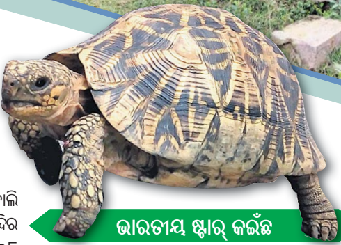
ଭାରତୀୟ ସ୍ତୂର୍ କଳ୍ପ

ବୋଲି ବିଶ୍ୱାସ ରହିଛି। ଗଞ୍ଜାମ ଜିଲ୍ଲାର ସାଧବ ପୁତ୍ରମାନେ ସପ୍ତମକୁ ନୌବାଣିଜ୍ୟ କରିବା ପାଇଁ ଯାଉଥିବା ବେଳେ ମା'ଭୈରବୀଙ୍କୁ ପୂଜାର୍ଚ୍ଚନା କରି ପ୍ରାକୃତିକ ଦୁର୍ବିପାକରୁ ମୁକ୍ତି ପାଇବା ପାଇଁ ଆଶିଷ ଭିକ୍ଷା କରୁଥିଲେ ବୋଲି କିମ୍ବଦନ୍ତୀରୁ ଜଣାପଡ଼ିଛି। ମନ୍ଦିର ନିକଟରେ ଜଗନ୍ନାଥ ମନ୍ଦିର ଏବଂ ୧୦୮ ମନ୍ଦିର ପ୍ରତିଷ୍ଠା ହୋଇଛି। ଏହି ପୀଠରେ ଅନ୍ୟ ଦିନମାନଙ୍କ ଅପେକ୍ଷା ଦଶହରାରେ ନବରାତ୍ର ପୂଜା ହୋଇଥାଏ। ମା'ଙ୍କ ଘଟକୁ ହରତଳା ଗ୍ରାମ ପରିକ୍ରମା କରାଯାଇଥାଏ। ଭକ୍ତ ମାନଙ୍କ ପାଇଁ ଅନୁପ୍ରସାଦ, ଖେରୁଡ଼ି ଭୋଗ, ପୁଲିଆରା ଓ ଲତୁ ଭୋଗ ଆଦି ଭୋଗ ମିଳିଥାଏ। ପ୍ରତିଦିନ ଶ୍ରଦ୍ଧାଳୁ ମାନଙ୍କ ପ୍ରସାଦ ପରିବେଷଣ ପାଇଁ ମନ୍ଦିର ପରିଚାଳନା କମିଟି ନିୟନ୍ତ୍ରିତ କରୁଛନ୍ତି। ଆଖପାଖର ୭୦ ଖଣ୍ଡ ଗ୍ରାମକୁ ନେଇ ମନ୍ଦିର ପରିଚାଳନା କମିଟି ଗଠିତ ହୋଇଛି। ଦେବୀ ପୀଠରେ ତିନୋଟି ଭାରତୀୟ ସ୍ତୂର୍ କଳ୍ପ ରହିଛି, ଯାହା ପର୍ଯ୍ୟଟକମାନଙ୍କୁ ଆକୃଷ୍ଟ କରିଛି।