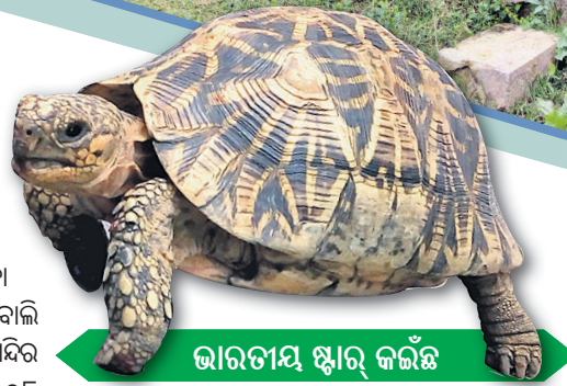
ଭାରତୀୟ ସ୍ୱାର୍ କର୍ତ୍ତୃ

ବୋଲି ବିଶ୍ୱାସ ରହିଛି। ଗଞ୍ଜାମ ଜିଲ୍ଲାର ସାଧବ ପୁତ୍ରମାନେ ନୌବାଣିଜ୍ୟ କରିବା ପାଇଁ ଯାଉଥିବା ବେଳେ ମା'ଭୈରବୀଙ୍କୁ ପୂଜାର୍ଚ୍ଚନା କରି ପ୍ରାକୃତିକ ଦୁର୍ଘଟାକରୁ ମୁକ୍ତି ପାଇବା ପାଇଁ ଆଶିଷ ଭିକ୍ଷା କରୁଥିଲେ ବୋଲି କିମ୍ବଦନ୍ତୀରୁ ଜଣାପଡ଼ିଛି। ମନ୍ଦିର ନିକଟରେ ଜଗନ୍ନାଥ ମନ୍ଦିର ଏବଂ ୧୦୮ ମନ୍ଦିର ପ୍ରତିଷ୍ଠା ହୋଇଛି। ଏହି ପୀଠରେ ଅନ୍ୟ ଦିନମାନଙ୍କ ଅପେକ୍ଷା ଦଶହରାରେ ନବରାତ୍ର ପୂଜା ହୋଇଥାଏ। ମା'ଙ୍କ ଘଟକୁ ହରତଳା ଗ୍ରାମ ପରିକ୍ରମା କରାଯାଇଥାଏ। ଭକ୍ତ ମାନଙ୍କ ପାଇଁ ଅନ୍ନ ପ୍ରସାଦ, ଖେରୁଡ଼ି ଭୋଗ, ପୁଲିଆରା ଓ ଲତୁ ଭୋଗ ଆଦି ଭୋଗ ମିଳିଥାଏ। ପ୍ରତିଦିନ ଶ୍ରଦ୍ଧାଳୁ ମାନଙ୍କ ପ୍ରସାଦ ପରିବେଷଣ ପାଇଁ ମନ୍ଦିର ପରିଚାଳନା କମିଟି ନିୟନ୍ତ୍ରିତ କରୁଛନ୍ତି। ଆଖପାଖର ୭୦ ଖଣ୍ଡ ଗ୍ରାମକୁ ନେଇ ମନ୍ଦିର ପରିଚାଳନା କମିଟି ଗଠିତ ହୋଇଛି। ଦେବୀ ପୀଠରେ ତିନୋଟି ଭାରତୀୟ ସ୍ୱାର୍ କର୍ତ୍ତୃ ରହିଛି, ଯାହା ପର୍ଯ୍ୟଟକମାନଙ୍କୁ ଆକୃଷ୍ଟ କରିଛି।