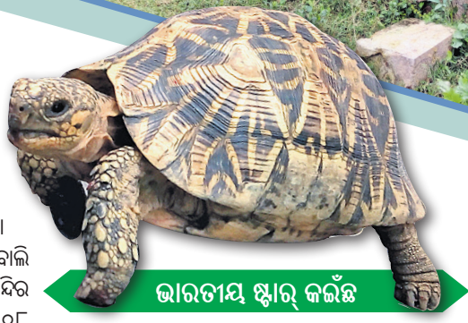
ଭାରତୀୟ ଷ୍ଟାର୍ କଇଁଛ

ବୋଲି ବିଶ୍ଵାସ ରହିଛି। ଗଞ୍ଜାମ ଜିଲ୍ଲାର ସାଧବ ପୁତ୍ରମାନେ ସମୁଦ୍ରକୁ ନୌବାଣିଜ୍ୟ କରିବା ପାଇଁ ଯାଉଥିବା ବେଳେ ମା'ଭୈରବୀଙ୍କୁ ପୂଜାର୍ଚ୍ଚନା କରି ପ୍ରାକୃତିକ ଦୁର୍ବିପାକରୁ ମୁକ୍ତି ପାଇବା ପାଇଁ ଆଶିଷ ଭିକ୍ଷା କରୁଥିଲେ ବୋଲି କିମ୍ବଦନ୍ତୀରୁ ଜଣାପଡ଼ିଛି। ମନ୍ଦିର ନିକଟରେ ଜଗନ୍ନାଥ ମନ୍ଦିର ଏବଂ ୧୦୮ ମନ୍ଦିର ପ୍ରତିଷ୍ଠା ହୋଇଛି। ଏହି ପୀଠରେ ଅନ୍ୟ ଦିନମାନଙ୍କ ଅପେକ୍ଷା ଦଶହରାରେ ନବରାତ୍ର ପୂଜା ହୋଇଥାଏ। ମା'ଙ୍କ ଘରକୁ ହରତଙ୍ଗ ଗ୍ରାମ ପରିକ୍ରମା କରାଯାଇଥାଏ। ଭକ୍ତ ମାନଙ୍କ ପାଇଁ ଅନ୍ନ ପ୍ରସାଦ, ଖେରୁଡ଼ି ଭୋଗ, ପୁଲିଆରା ଓ ଲତୁ ଭୋଗ ଆଦି ଭୋଗ ମିଳିଥାଏ। ପ୍ରତିଦିନ ଶ୍ରଦ୍ଧାଳୁ ମାନଙ୍କ ପ୍ରସାଦ ପରିବେଷଣ ପାଇଁ ମନ୍ଦିର ପରିଚାଳନା କମିଟି ନିୟନ୍ତ୍ରିତ କରୁଛନ୍ତି। ଆଖପାଖର ୭୦ ଖଣ୍ଡ ଗ୍ରାମକୁ ନେଇ ମନ୍ଦିର ପରିଚାଳନା କମିଟି ଗଠିତ ହୋଇଛି। ଦେବୀ ପୀଠରେ ତିନୋଟି ଭାରତୀୟ ଷ୍ଟାର୍ କଇଁଛ ରହିଛି, ଯାହା ପର୍ଯ୍ୟଟକମାନଙ୍କୁ ଆକୃଷ୍ଟ କରିଛି।