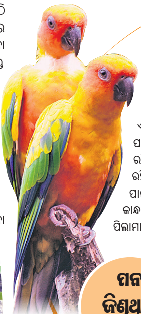
ପାନ ଜିଣୁଥିବା ସ୍ଥାନ

ପକ୍ଷୀ ଦେଖିବା ପାଇଁ ନନ୍ଦନକାନନ ଜୈବ ଉଦ୍ୟାନରେ ୩ ସ୍ଥାନ ରହିଛି। ସେଥିମଧ୍ୟରୁ 'ପାଦଚଲା ବିହଙ୍ଗ ସରଣୀ' (ଝାଙ୍କ-ଥ୍ରୋ ଆଭିଏରି)କୁ ପର୍ଯ୍ୟଟକ ଅଧିକ ପସନ୍ଦ କରନ୍ତି। ୨୦୧୪ ଡିସେମ୍ବର ୨୯ରେ ଉଦ୍‌ଘାଟିତ ହୋଇଥିବା ଏହି ସରଣୀ ନିମନ୍ତେ ୯୦ ଲକ୍ଷ ଟଙ୍କା ଖର୍ଚ୍ଚ ହୋଇଥିଲା। ଏହା ଏପରି ଜଙ୍ଗଲରେ ତିଆରି ହୋଇଛି, ଯେଉଁଠି ପକ୍ଷୀମାନଙ୍କ ଗହଣରେ ରହି ପର୍ଯ୍ୟଟକ ମନଲୋଭା ପ୍ରାକୃତିକ ପରିବେଶର ମଜା ଉଠାଇପାରିବେ। ଏହା ମଧ୍ୟରେ ରହିଛି ୨୦ଟି ପକ୍ଷୀବସା ସାଙ୍ଗକୁ କୃତ୍ରିମ ଝରଣା। ପକ୍ଷୀମାନଙ୍କ ବସବାସ ପାଇଁ ଅନେକ ଗଛ ରହିଛି ବର୍ତ୍ତମାନ ଅନୁ୍ୟନ ୧୫ ପ୍ରଜାତିର ପ୍ରାୟ ୧୫୦ ପକ୍ଷୀ ଖୋଲାରେ ରହିଛନ୍ତି। ଏମାନଙ୍କ ପାଇଁ କୌଣସି ପିଞ୍ଜରା ହୋଇନାହିଁ। ପର୍ଯ୍ୟଟକମାନେ ସେଠାକୁ ଗଲେ ପକ୍ଷୀମାନେ ସେମାନଙ୍କ କାନ୍ଧ, ମୁଣ୍ଡରେ ମଧ୍ୟ ବସିଯାଆନ୍ତି, ଯାହା ପର୍ଯ୍ୟଟକଙ୍କୁ ଖୁବ୍ ଆନନ୍ଦ ଦେଇଥାଏ। ବିଶେଷକରି ପିଲାମାନଙ୍କ ପାଇଁ ମାଟି ଉପରେ ବସିପାରୁଥିବା ଏବଂ ଅଳ୍ପ ଉଚ୍ଚରେ ଉଡୁଥିବା ପକ୍ଷୀ ଅଧିକ ଆକର୍ଷଣୀୟ ସାଜୁଛନ୍ତି। ତେବେ ଏଠାରେ ଥିବା ସର୍ବ କନ୍ୟୁର୍, ସିଲଭର୍ ଫ୍ ଡି କା, ପକ୍ଷୀ, ଗୋଲଡେନ୍ ଫିଙ୍ଗାଏ ପ୍ରଜାତିର ଦର୍ଶକଙ୍କୁ ଅଧିକ ଭଲଲାଗେ।