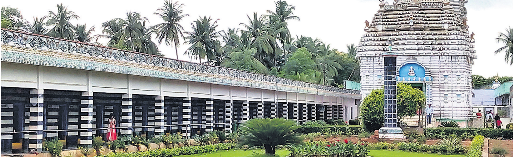
ରିପୋର୍ଟ: ବ୍ରହ୍ମପୁରରୁ ସମୀର କାନ୍ତ ତ୍ରିପାଠୀ ଏବଂ ଗୋପାଳପୁରରୁ ନବୀନ ରାଜ୍ ଆଚାରୀ