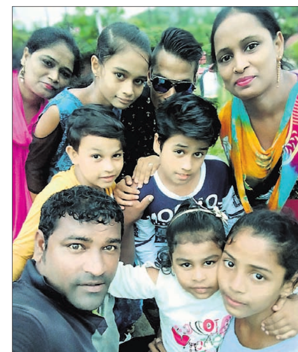
@ ମହମ୍ମଦ ଅଜରର