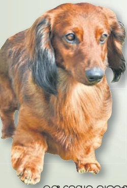
ଲଙ୍କ୍ ହେୟାର ଡାକ୍ସହୁଣ୍ଡ