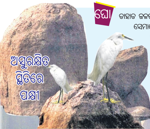
ଅସୁରକ୍ଷିତ ସ୍ଥିତିରେ ପକ୍ଷୀ

ପକ୍ଷୀ ସମ୍ଭାର : ଲକ୍ଷ୍ୟ ଥିଲା ଚିଲିକା। ହେଲେ ବାଟରେ ଘୋଡ଼ାହାଡ଼ ଜଳଭଣ୍ଡାର ଅନୁକୂଳ ପରିବେଶ ଓ ଖାଦ୍ୟସମ୍ଭାର ଦେଖି ଏଠାକୁ ଚାଲିଆସୁଛନ୍ତି ଅନେକ ବିଦେଶୀଗତ ପକ୍ଷୀ। ଗତ ବର୍ଷ ଶୀତଋତୁରେ ଘୋଡ଼ାହାଡ଼ ଜଳଭଣ୍ଡାରରେ ଅନେକ ବିରଳ ପ୍ରଜାତିର ପକ୍ଷୀଙ୍କ ସମାଗମ ହୋଇଥିଲା, ଯାହାକି ପ୍ରକୃତିପ୍ରେମୀଙ୍କୁ ଆକୃଷ୍ଟ କରିଥିଲା। ଏହି ଜଳଭଣ୍ଡାରର ପ୍ରାକୃତିକ ପରିବେଶରେ ଏବେ ଉଡ଼ି ବୁଲୁଛନ୍ତି ହଂସ ଓ ବଗଳାତୀୟ ବିଭିନ୍ନ ଦୁଆଁ କିସମର ପକ୍ଷୀ। ପରିବ୍ରାଜକ ପକ୍ଷୀମାନଙ୍କ ମଧ୍ୟରେ ରହିଛନ୍ତି ପାଣ୍ଡରା ପୁଆଳ, ବୁରୁମା, ବେଶାଡ଼ାହୁକ, ଜଟିଆ ଗେଣ୍ଡି ଓ ଛୋଟ ଏରା ଆଦି। ଏମାନେ ଚୁଷ୍ଟ, ସୁରୋପ ଭଳି ସୁବୁରୁ ଅଞ୍ଚଳରୁ ଚିଲିକା ଅଭିମୁଖେ ଉଡ଼ି ଆସିଥାନ୍ତି ବୋଲି ଗବେଷକ ଅନୁଭବ କର କୌଣସି କହିଛନ୍ତି। ତେବେ ସାମୟିକ ଭ୍ରମଣ ଭଳି ଘୋଡ଼ାହାଡ଼ ଜଳଭଣ୍ଡାରରେ ଏମାନେ କିଛି ଦିନ ବିତାଉଛନ୍ତି। ବିଗତ କିଛି ବର୍ଷ ହେବ ଏହି ଦୃଶ୍ୟ ସ୍ଥାନୀୟ ବାସିନ୍ଦା ଓ ପକ୍ଷୀପ୍ରେମୀଙ୍କୁ ଆକୃଷ୍ଟ କରୁଛି। ଜଳଭଣ୍ଡାରର ଉପରମୁଣ୍ଡ ପୁରୁଣାପାଣି ଚରଭଙ୍ଗ ଗ୍ରାମ ନିକଟରେ ନଦୀର ସନ୍ତସନ୍ତୀ ଚୂଣ୍ଡାଭୂମିରେ ଏଭଳି ପକ୍ଷୀଙ୍କୁ ଠାବ କରାଯାଇଛି। ଏହା ସେମାନଙ୍କ ପାଇଁ ନିରାପଦ ଓ ଖାଦ୍ୟ ପ୍ରଚୁର ଅଞ୍ଚଳ ବୋଲି ବିବେଚନା କରାଯାଉଛି। ଚଳିତ ବର୍ଷ ମଧ୍ୟ ୨୯ ପ୍ରଜାତିର ୧ ହଜାର ୧୯ ପକ୍ଷୀ ରହିଥିବା ନେଇ ଗଣନା କରାଯାଇଥିଲା ।