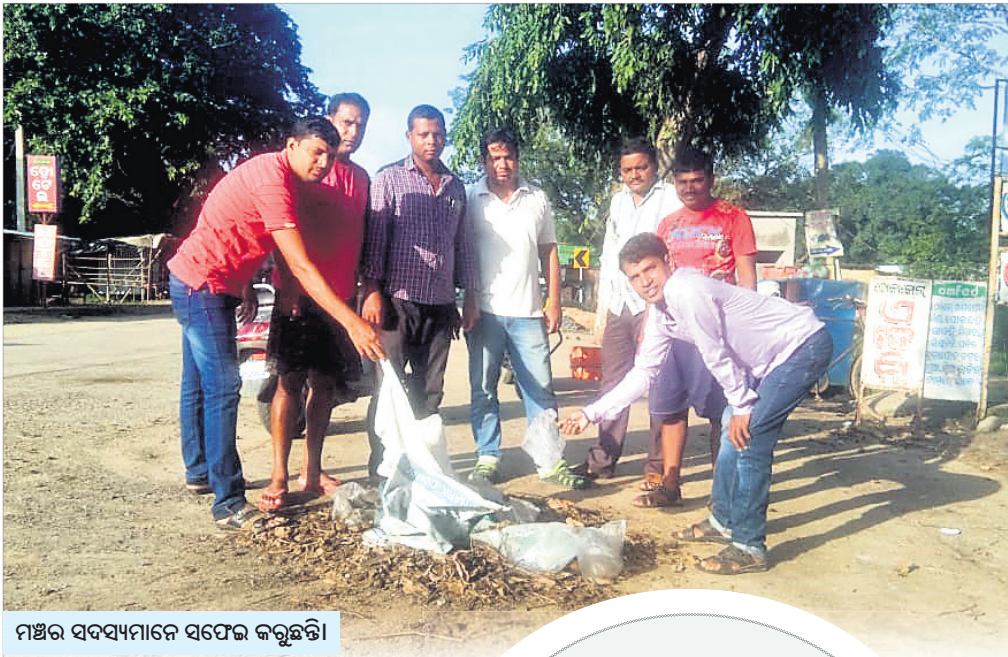
ମଞ୍ଚର ସଦସ୍ୟମାନେ ସଫେଇ କରୁଛନ୍ତି।

ସୁ ବକମାନେ ସଙ୍ଗଠିତ ହେଲେ ଅସମ୍ଭବକୁ ସମ୍ଭବ କରିପାରିବେ। ସେମାନଙ୍କ ଭିତରେ ଲୁଚି ରହିଛି ଅମାପ ଶକ୍ତି। ସମାଜର ବିକାଶ ଓ କଲ୍ୟାଣ ଲାଗି ଯୁବଶକ୍ତିକୁ ବିନିଯୋଗ କରିବା ଲକ୍ଷ୍ୟ ନେଇ ୨୦୧୬ରୁ ବାଲେଶ୍ଵର ଜିଲ୍ଲା ଖଇରା ବ୍ଲକ ଗଣ୍ଡିବେଡ଼ ଅଞ୍ଚଳର କେତେକ ଯୁବକ ସେଛାକୃତ ଭାବେ ଅଣ୍ଟା ଭିଡ଼ିଛନ୍ତି। ଗ୍ରାମୀଣ ଯୁବକଙ୍କ ପ୍ରାଣରେ ଉତ୍ସାହନା ଖେଳାଇ ସେବା, ସହାୟତା ଓ ସମାଜସେବା ଭଳି କାର୍ଯ୍ୟ ଲାଗି ସେମାନେ ଉତ୍ସାହିତ କରି ଆସୁଛନ୍ତି। ପରିବେଶର ସୁରକ୍ଷାକୁ ଦେଖିଛନ୍ତି ପ୍ରାଥମିକତା। ସେମାନଙ୍କ ଆଗାମୀ ଲକ୍ଷ୍ୟ ପଲିଥିନମୁକ୍ତ ପରିବେଶ ଗଠନ। ସମସ୍ତଙ୍କୁ ଏହି ଅଭିଯାନରେ ସାମିଲ କରି ଆଗକୁ ବଢ଼ିବା ସ୍ଵପ୍ନରେ ସେମାନେ ବିଭୋର। ଅବସର ସମୟରେ ପରିବେଶ ସୁରକ୍ଷା ପାଇଁ ନିୟମିତ କାର୍ଯ୍ୟ କରି ଏହି ଯୁବଗୋଷ୍ଠୀ ବେଶ୍ ଚର୍ଚ୍ଚାକୁ ଆସିଛନ୍ତି। ଖଇରା ବ୍ଲକଠାରୁ ଗଣ୍ଡିବେଡ଼ ବଜାରର ଦୂରତା ପ୍ରାୟ ୮ କି.ମି.। ଏହା ମଧ୍ୟମ ଧରଣର ବଜାର ହୋଇଥିଲେ ବି ଏକ ବ୍ୟବସାୟିକ ପେଣ୍ଠମୁଳୀ। ନିତ୍ୟ ବ୍ୟବହାରୀୟ ଜିନିଷ ପାଇଁ ଅଞ୍ଚଳବାସୀ ଏହା ଉପରେ ନିର୍ଭର କରନ୍ତି। ଏହା ଆଖପାଖରେ ମଧ୍ୟ ଗଢ଼ିଉଠିଛି ବହୁ ଅନୁଷ୍ଠାନ। ଜନଗହଳପୂର୍ଣ୍ଣ ଏହି ବଜାରର ପରିମଳ ସମସ୍ୟା ପ୍ରଥମେ ଏହି ଯୁବଗୋଷ୍ଠୀଙ୍କୁ ଚିନ୍ତାରେ ପକାଇଥିଲା। ସେମାନେ ସଙ୍ଗଠିତ ହୋଇ ବଜାରରେ ସଫେଇ କାର୍ଯ୍ୟ ଆରମ୍ଭ କରିଥିଲେ। ଏବେ ବଜାର ଆରମ୍ଭରୁ ଶେଷ ପର୍ଯ୍ୟନ୍ତ ପରିବେଶକୁ ନିୟମିତ ପରିଷ୍କାର କରି ରଖୁଛନ୍ତି। ନିର୍ଦ୍ଦିଷ୍ଟ ସ୍ଥାନରେ ବସାଯାଇଛି ଡଷ୍ଟବିନ, ଯେଉଁଥିରେ ଆବର୍ଜନା ପକାଯାଉଛି। ବ୍ୟବସାୟୀ ଓ ସାଧାରଣ ଲୋକେ ସଚେତନ ହୋଇ ଏହି ଯୁବଗୋଷ୍ଠୀଙ୍କ ପ୍ରତି ସହାୟତାର ହାତ ବଢ଼ାଇଛନ୍ତି। ଆଗରୁ ବଜାରର ବିଭିନ୍ନ ସ୍ଥାନରେ ଫିଙ୍ଗି ଦିଆଯାଉଥିବା ପଲିଥିନ ଗଦା ହୋଇ ରହୁଥିଲା। ଏହା ପରିବେଶ ପ୍ରତି କିଭଳି ବିପଦ ଆଣୁଛି ଏହି ଯୁବକମାନେ ଲୋକଙ୍କୁ ବୁଝାଇ 'ପଲିଥିନମୁକ୍ତ ସ୍ଵଚ୍ଛ ଗଣ୍ଡିବେଡ଼' ଗଠନ ଲାଗି ସଂକଳ୍ପ ନେଇଛନ୍ତି। ସେମାନଙ୍କ ମୁହଁରେ ଗୋଟିଏ ସ୍ନୋଗାନ ପଲିଥିନମୁକ୍ତ ଗଣ୍ଡିବେଡ଼।