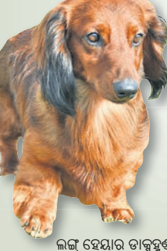
ଲଙ୍କ୍ ହେୟାର ଡାକ୍ସହୁଣ୍ଡ