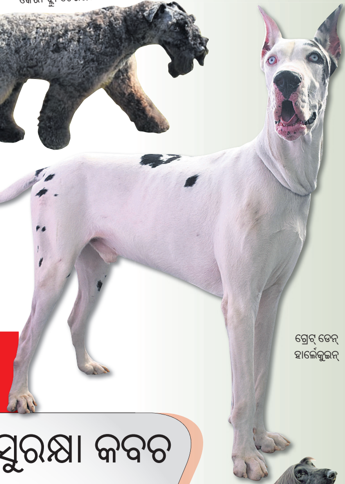
ଗ୍ରେଟ୍ ଡେନ୍ ହାଇକେକ୍ସଲର୍