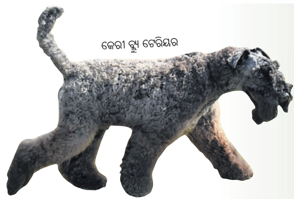
କେରୀ ବ୍ଲ୍ୟୁ ଟେରିୟର