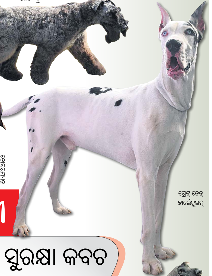
ଗ୍ରେଟ୍ ଡେନ୍ ହାଲ୍‌କ୍ସ୍‌କ୍ଲିନ୍