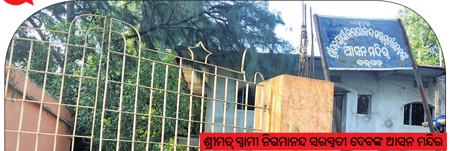
ଶ୍ରୀମତୀ ସ୍ୱାମୀ ନିଗମାନନ୍ଦ ସରସ୍ୱତୀ ଦେବଙ୍କ ଆସନ ମନ୍ଦିର