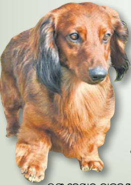
ଲଙ୍ଗ୍ ହେୟାର ଡାକ୍ସ୍‌ହୁଣ୍ଡ