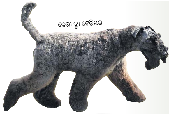
କେରୀ ବ୍ଲୁ ଟେରିୟର