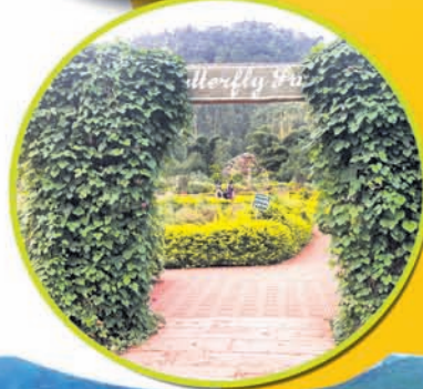
ପ୍ରସ୍ତୁତି: ଅରୁଣ ସାହୁ, ଦାରିଙ୍ଗବାଡ଼ି