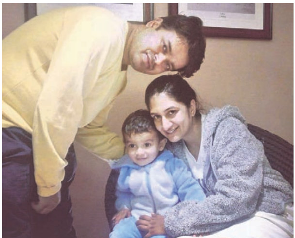
ପରିବାରବର୍ଗଙ୍କ ସହ ପ୍ରୋଶିଶ୍

ଭିଜୁଶୈଳୀରେ ବର୍ତ୍ତମାନର ପିଢିକ ମଧ୍ୟରେ ଓଡ଼ିଆର ଲୋକପ୍ରିୟତା କରିବାରେ ସଫଳ ହୋଇଥିଲେ। 'ସବୁବେଳେ ଫୋନ୍', 'ସଂସ୍କାରୀ ସେଲଫି', 'ଧେରୁ ଡେରିକି', 'କଣ କଲା ସେ', 'ନାଲ ନାଲ ନାଇମ', 'ଆଲୋ ଇୟେ କି କଥା', 'ରୋକା ଚୋକା', 'ବୋବାଲ ଚୋକା' ଭଳି ଦୈନନ୍ଦିନ ଜୀବନରେ ବ୍ୟବହୃତ ହେଉଥିବା ଓଡ଼ିଆ ଶବ୍ଦ, କୁହାକଥା ଓ କିଛି ଫିଲ୍ମ ତାଏଲର୍ ଆଦିକୁ ନୂଆ