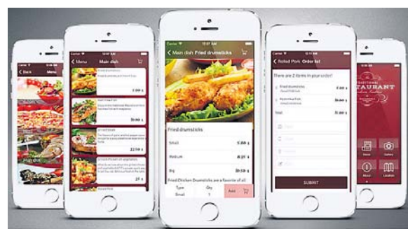
– ପୌର୍ଣ୍ଣମାସୀ, ଲିମ୍ବା ବିଶୋଇ

ବର୍ତ୍ତମାନ ପ୍ରାୟ ଅଧିକାଂଶ ଖବରକାଗଜରେ ଖାଦ୍ୟର ପ୍ରସ୍ତୁତି ପ୍ରଣାଳୀ ପ୍ରକାଶ ପାଉଥିବା ଦେଖିବାକୁ ମିଳୁଛି । ଏମିତିକି ପାଠକମାନଙ୍କ ଅନୁରୋଧ ମୁତାବକ ମଧ୍ୟ ନୂଆ ଖାଦ୍ୟର ପ୍ରସ୍ତୁତି ପ୍ରଣାଳୀ ପ୍ରକାଶିତ ହେଉଛି । ଏହାକୁ ସଂଗ୍ରହ କରି ରଖିବା ଏବଂ ଏଥିରୁ ଶିଖି ନିଜେ ଉତ୍ତମ ଖାଦ୍ୟକୁ ପ୍ରସ୍ତୁତ କରିବାରେ ଅନେକେ ଉପକୃତ ହେଉଛନ୍ତି । ସପ୍ତାହକୁ ଥରେ କିମ୍ବା ଦୁଇଥର ଏହା ପ୍ରକାଶ ପାଇଥିବାରୁ ସବୁବେଳେ କିଛି ନୂଆ ନୂଆ ଆଇଟମ୍‌ର ଆଇଡିଆ ମିଳିପାରୁଛି ।