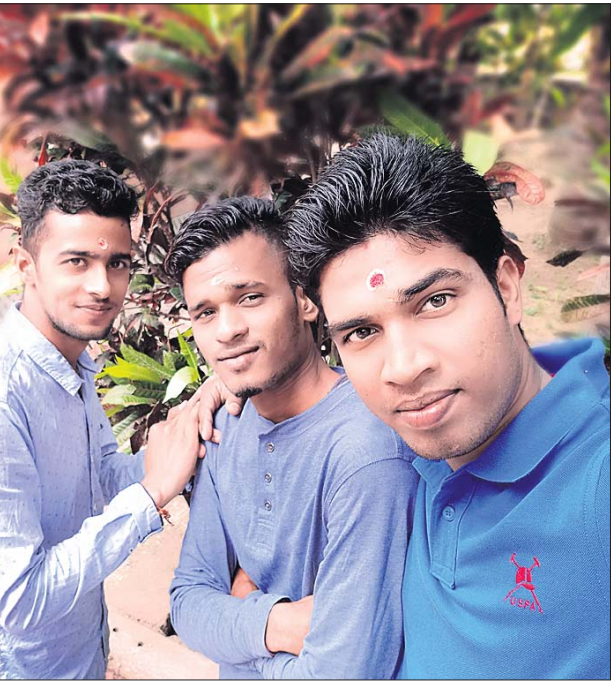
@ ଚିନ୍ମୟ ହୋତା