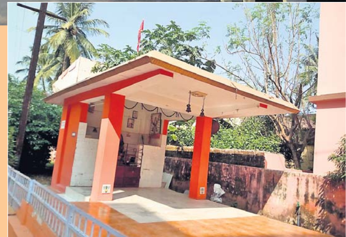
- ରିପୋର୍ଟ: ତ୍ରିନାଥ ମହାନ୍ତି

ଦ ଥ୍ରାଲ୍ଡ଼ ପ୍ରାପ୍ତିକ ଛକରୁ ବେହେରାସାହି ଅଭିମୁଖେ ଗଲେ ବାମପଟେ ପଡ଼ିବ ମେଟ୍ରୋସିଟି ଆପାର୍ଟମେଣ୍ଟ । ଏହା ରାଜଧାନୀର ତୃତୀୟ ପୁରୁଣା ଆପାର୍ଟମେଣ୍ଟ । ଉନ୍ନତ ଜ୍ଞାନକୌଶଳରେ ନିର୍ମିତ ଏହି ଆପାର୍ଟମେଣ୍ଟ ଦେଖିବାକୁ ବେଶ ସୁନ୍ଦର ଓ ମନୋରମ । ଆପାର୍ଟମେଣ୍ଟ ନିର୍ମାଣଶୈଳୀ ଓ ଏହାର ଚାରିପଟେ ଥିବା ସମସ୍ତ ବ୍ୟବସ୍ଥା ଅତ୍ୟନ୍ତ ଆକର୍ଷଣୀୟ । ଆପାର୍ଟମେଣ୍ଟର ପ୍ରବେଶପଥର ଦକ୍ଷିଣ ପାର୍ଶ୍ୱରେ ରହିଛି ଗଣେଶ ମନ୍ଦିର । ପ୍ରତ୍ୟହ ସକାଳେ ଆପାର୍ଟମେଣ୍ଟର ବାସିନ୍ଦାମାନେ ଏଠାରେ ପୂଜାର୍ଚ୍ଚନା କରନ୍ତି । ଏଠାରେ ବିଭିନ୍ନ ଭାଷା, ଧର୍ମ ଓ ଜାତିର ଲୋକେ ରହୁଛନ୍ତି । କାହା ମଧ୍ୟରେ କଳିଙ୍ଗଗଡ଼ା କି ଭେଦଭାବ ଦେଖିବାକୁ ମିଳେନାହିଁ । ସମସ୍ତେ ଅନ୍ୟକୁ ବିପଦ ଆପଦରେ ସହଯୋଗର ହାତ ବଢ଼ାନ୍ତି ।