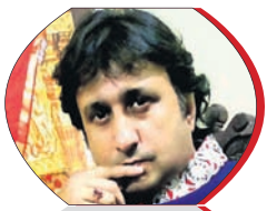
ରାତି ଅଧରେ ଶୁଟି ଗାଡ଼ି ଅନ୍ଧାରରେ ଓହ୍ଲାଇଦେଲା