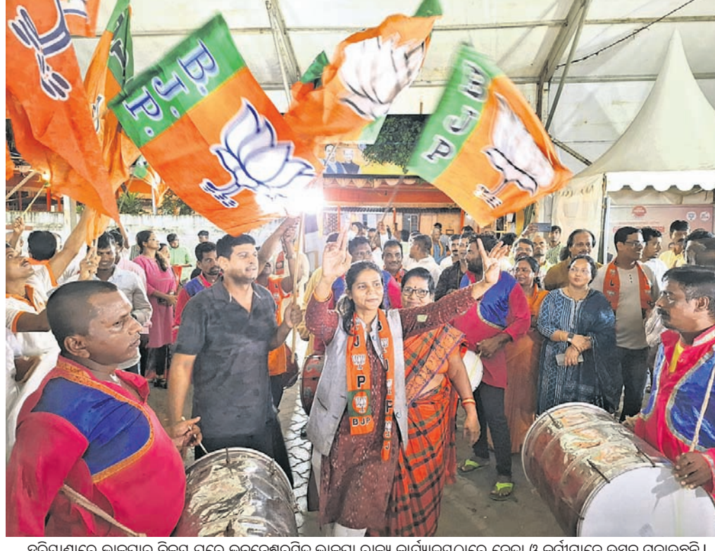
ହରିୟାଣାରେ ଭାଜପାର ବିଜୟ ପରେ ଭୁବନେଶ୍ୱରସ୍ଥିତ ଭାଜପା ରାଜ୍ୟ କାର୍ଯ୍ୟକ୍ରମରେ ନେତା ଓ କର୍ମୀମାନେ ଉତ୍ସବ ମନାଉଛନ୍ତି ।