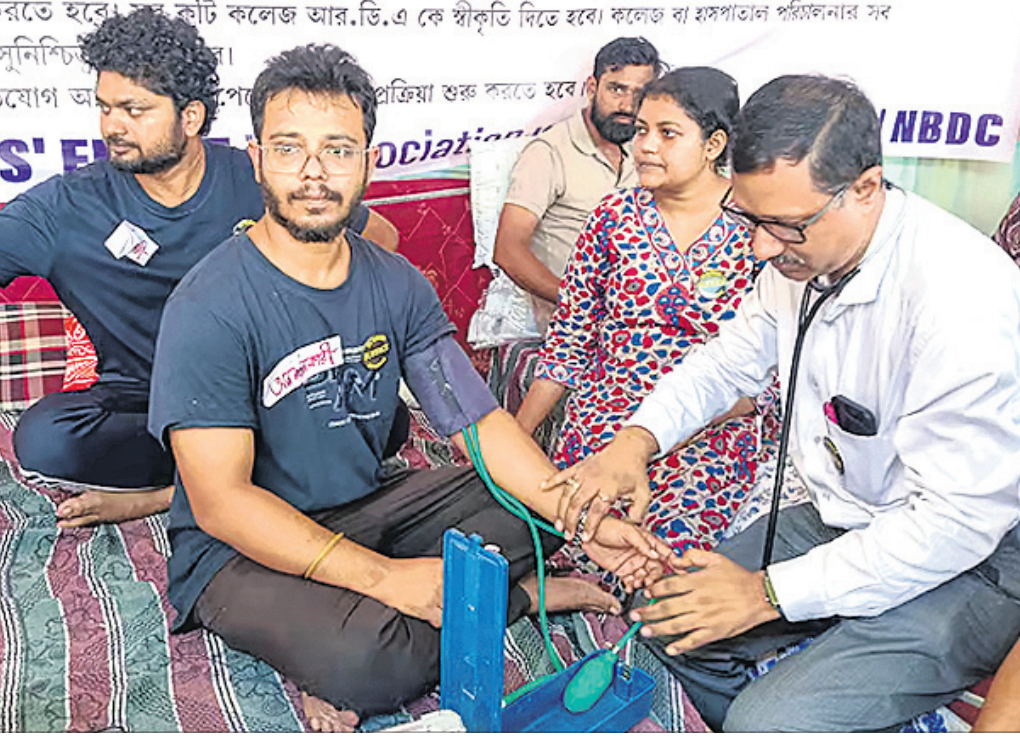
କୋଲକାତାରେ ଜୁନିୟର ଡାକ୍ତରମାନେ ଆମରଣ ଅନୁଷ୍ଠାନରେ ବସିଛନ୍ତି।

କରିଥିଲେ। ଜିଏସ୍‌ଟି ନମ୍ବର ପାଇବା ପାଇଁ ଏକ ଜାଲ ଲିଙ୍ଗ ରୁଦ୍ଧ ଅହମଦାବାଦ ଜିଏସ୍‌ଟି ବିଭାଗରେ ଅନ୍ତର୍ଲୀନରେ ଦାଖଲ ହୋଇଥିବା ନେଇ ଅଭିଯୋଗ ହୋଇଥିଲା, ଯାହାକୁ ନେଇ ଏକ ବଡ଼ ଧରଣର ଆପରାଧିକ ଶତ୍ରୁତା ରଚା ଯାଇଥିବା ଅନୁମାନ କରାଯାଇଛି। ଅଧିକାରୀଙ୍କ ପୂର୍ବରୁ ଅନୁଯାୟୀ, ୨୦୨୩ ମେ ୨୦୨୪ ମଧ୍ୟରେ ଏହି ଦୁର୍ଗତିରେ କେବଳ ଗୁଜରାଟକୁ ମୋଟ ୫୦ ହଜାର କୋଟିରୁ ଅଧିକ ଜାଲିଆଡି ବିଲ୍ ପ୍ରସ୍ତୁତ ହୋଇଥିବା ଅନୁମାନ କରାଯାଇଛି। ଏହି ମାମଲାରେ ଦାଖଲ ହୋଇଥିବା ଏସ୍‌ଆଇଆର୍ରେ ଅନେକ କମ୍ପାନୀ ଏବଂ ବ୍ୟକ୍ତିଗଣଙ୍କୁ ସହଅଭିଯୁକ୍ତ ଭାବେ ଚାଲିକାଳୁ କରାଯାଇଛି। ୦କେଇର ସମ୍ପୂର୍ଣ୍ଣ ପରିମାଣ ଜାଣିବା ପାଇଁ ତଦନ୍ତ ଜାରି ରହିଛି। କେନ୍ଦ୍ରୀୟ ଜିଏସ୍‌ଟି, ଇଓଡିଏ, ଏସ୍‌ଓଇ ଓ ବସ୍ତୁ ଅନ୍ୟ ଏଡିଏଟି ଏହି ତଦନ୍ତରେ ସାମିଲ ହୋଇଛି। ତଦନ୍ତ ଆଗକୁ ବଢ଼ିବା ପରେ ଗିରଫ ସଂଖ୍ୟା ବଢ଼ିବ ବୋଲି ଅନୁମାନ କରାଯାଇଛି।