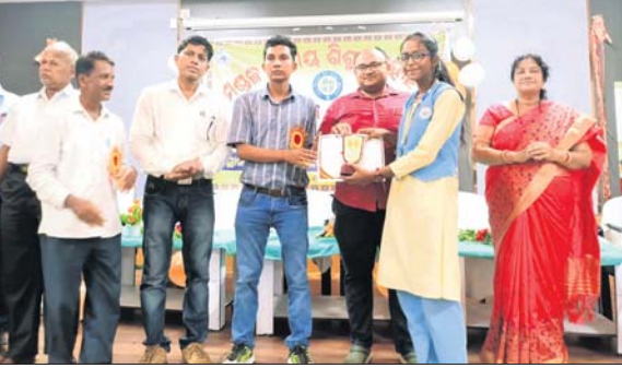
ଜଣେ କୃତା ପ୍ରତିଯୋଗୀଙ୍କୁ ଅତିଥି ପୂରସ୍କୃତ କରୁଛନ୍ତି ।