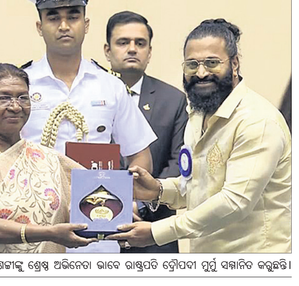
ରିଶାବ ଶେଖୀଙ୍କୁ ଶ୍ରେଷ୍ଠ ଅଭିନେତା ଭାବେ ରାଷ୍ଟ୍ରପତି ଦ୍ରୌପଦୀ ମୂର୍ତ୍ତି ସମ୍ମାନିତ କରୁଛନ୍ତି।