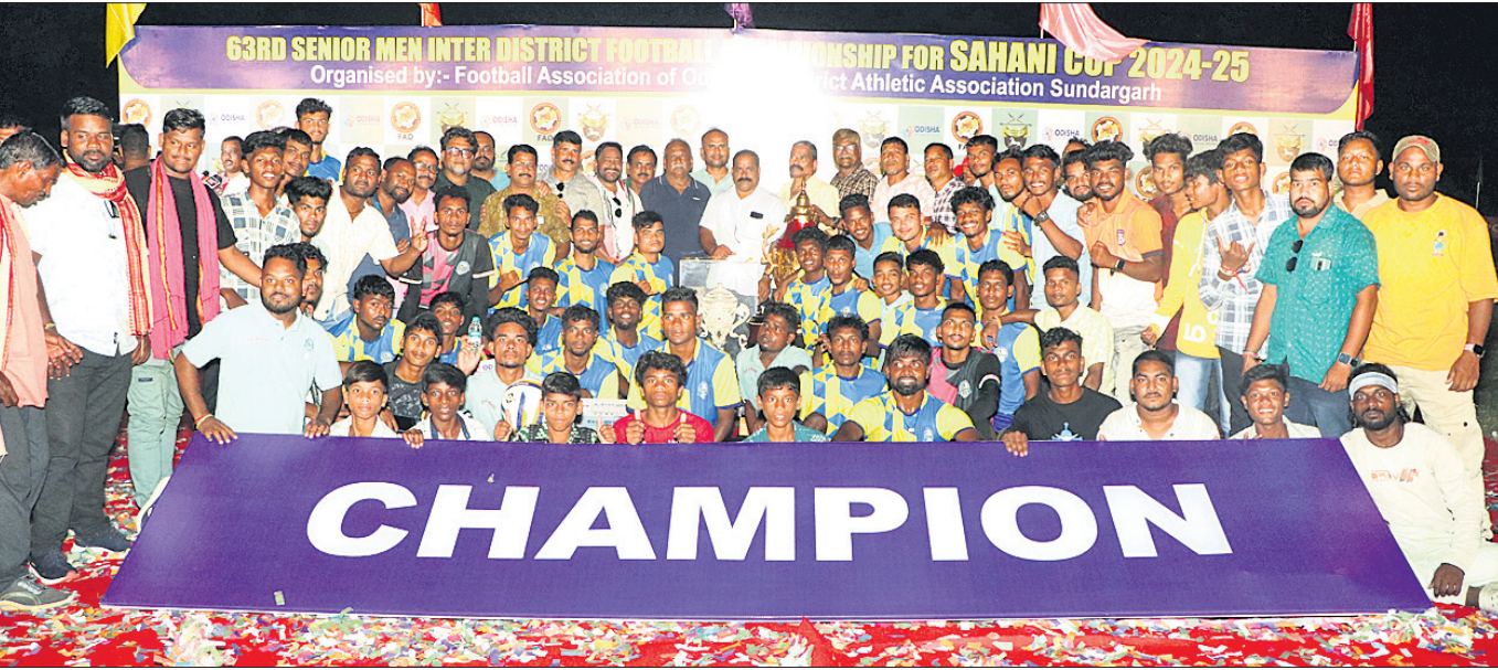
ଅତିଥିଙ୍କ ଗହଣରେ ସାହାଣୀ କପ୍ ଫୁଟବଲ୍ ଚାମ୍ପିୟନ ବରଗଡ଼ ଦଳ ।