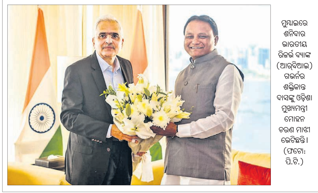
ମୁମ୍ବାଇରେ ଶନିବାର ଭାରତୀୟ ରିଜର୍ଭ ବ୍ୟାଙ୍କ (ଆର୍‌ବି‌ଆଇ) ଗଭର୍ନର ଶିଳ୍ପକାନ୍ତ ଦାସଙ୍କୁ ଓଡ଼ିଶା ମୁଖ୍ୟମନ୍ତ୍ରୀ ମୋହନ ଚରଣ ମାଝୀ ଭେଟିଛନ୍ତି।