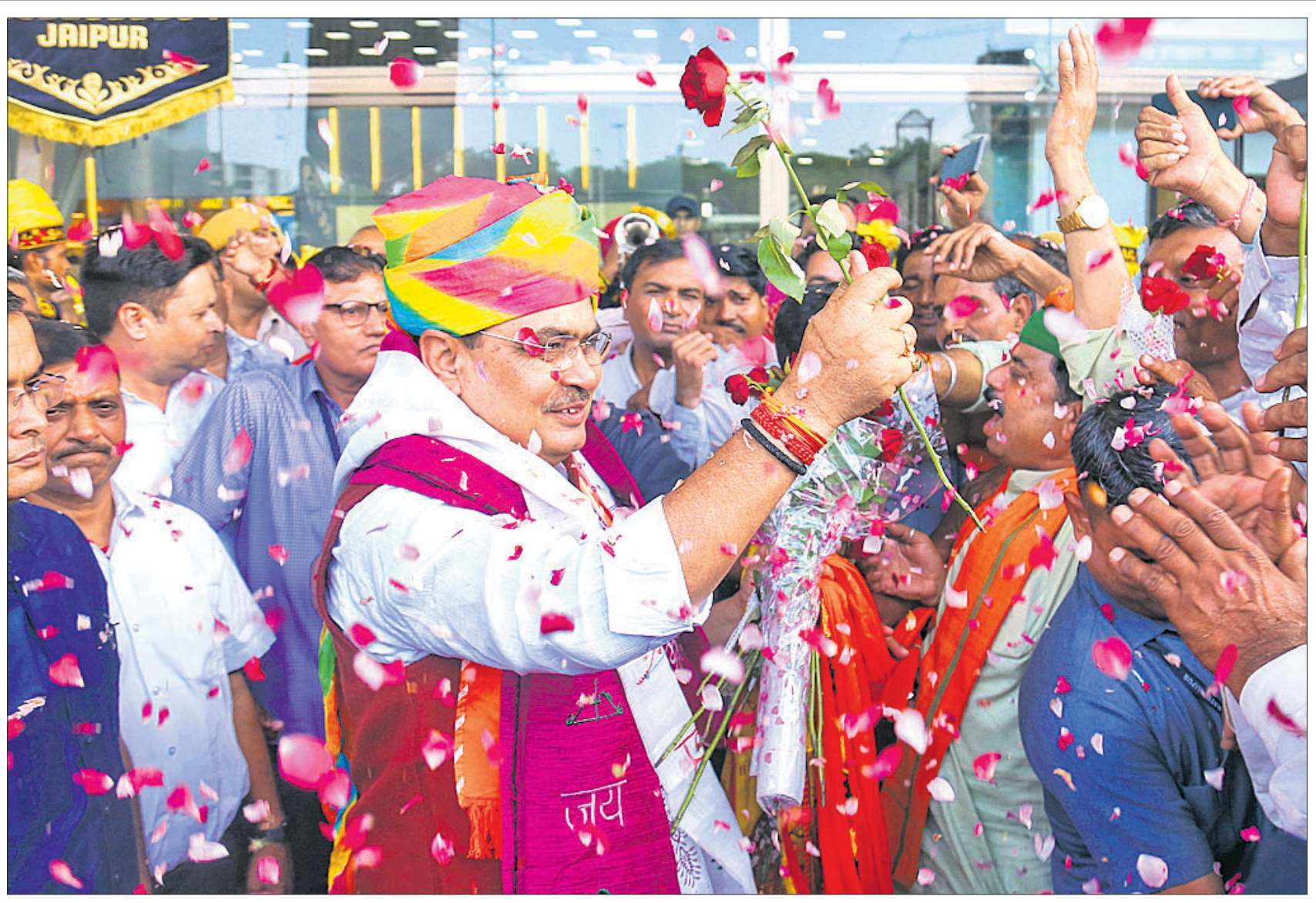
ପୁଞ୍ଜି ଆକର୍ଷଣ ପାଇଁ ବ୍ରିଟେନ ଯାଇଥିବା ରାଜସ୍ଥାନ ପୁଞ୍ଜିମନ୍ତ୍ରୀ ଭଜନଲାଲ ଶର୍ମା ରବିବାର ଗସ୍ତ ଶେଷକରି ଜୟପୁର ଯେଉଁଠି ପରେ ତାଙ୍କୁ ଭବ୍ୟ ସ୍ୱାଗତ କରାଯାଇଛି।