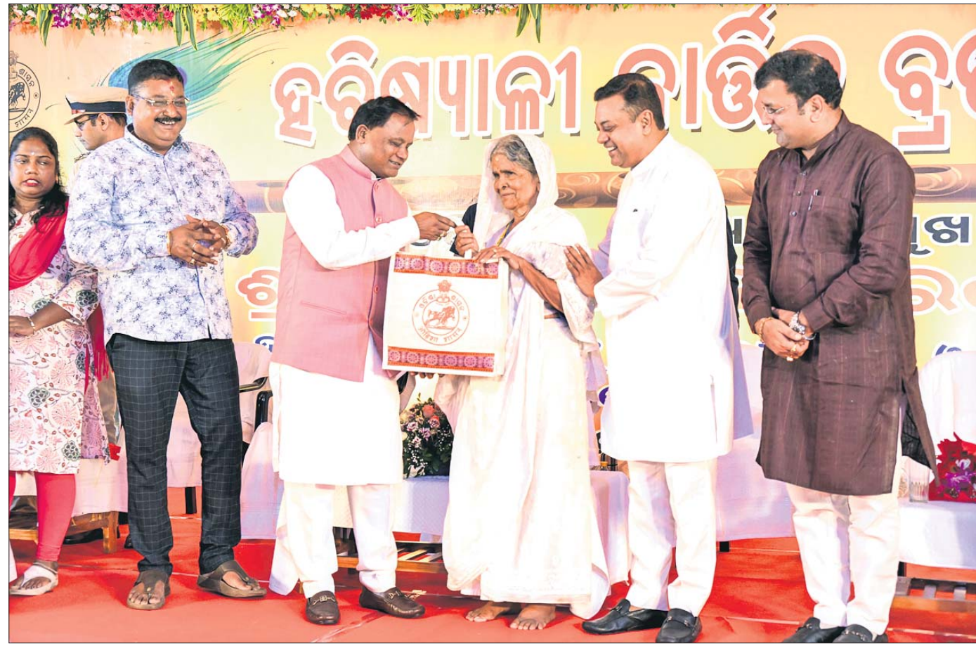
ମୁଖ୍ୟମନ୍ତ୍ରୀ ମୋହନ ଚରଣ ମାଝୀ ଜଣେ ହରିଷିଆଳିଙ୍କୁ ବ୍ରତ ସରଞ୍ଚାମ ଦିଏ ପ୍ରଦାନ କରୁଛନ୍ତି।