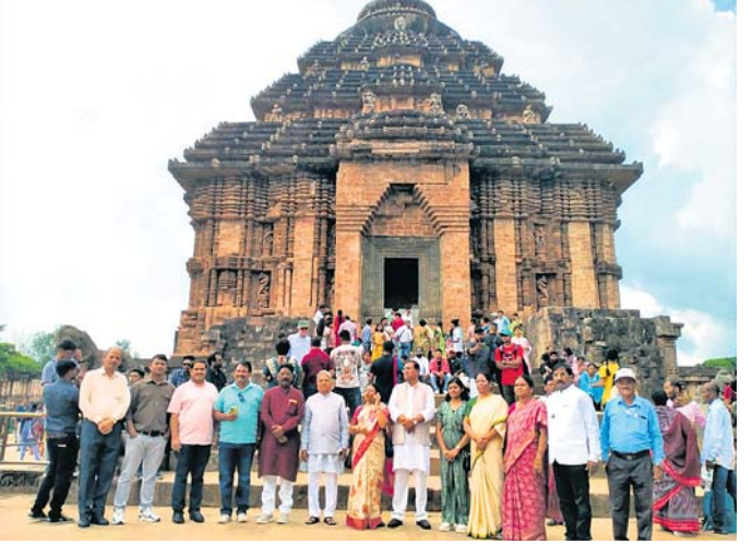
କୋଣାର୍କ, ୨୦୧୦

କେନ୍ଦ୍ର ସରକାରଙ୍କ ଜନମଙ୍ଗଳ, ଅନୁସୂଚିତ ଜାତି ଓ ଜନଜାତି ସମନ୍ୱୟ ସଂସଦୀୟ ଦଳର ଅଧ୍ୟକ୍ଷ ଏମ୍ପି ଫରାନ୍ ଡି'କୁଲସ୍ତ୍ରୋଙ୍କ ଅଧ୍ୟକ୍ଷତାରେ ରବିବାର ଏକ ୧୬ ଜଣିଆ ସଂସଦୀୟ ଦଳ ସୂର୍ଯ୍ୟମନ୍ଦିର ଓ ବ୍ୟାଖ୍ୟାନ କେନ୍ଦ୍ର ପରିଦର୍ଶନ କରିଛି। ସଂସଦୀୟ ଦଳ ସୂର୍ଯ୍ୟମନ୍ଦିର ନିକଟରେ ପହଞ୍ଚିବା ପରେ ସ୍ୱାକୃତିପ୍ରାପ୍ତ ଗାଇଁ ବିଶେଷ୍ଟର