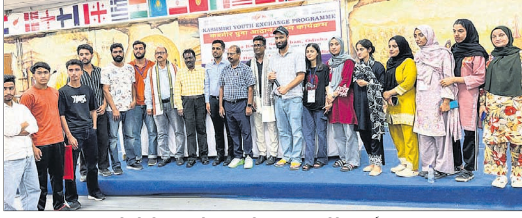
କିନ୍ ବିଶ୍ୱବିଦ୍ୟାଳୟ ପରିସରରେ ଚାଲିଥିବା କଣ୍ଟାର ଯୁବ ବିନିମୟ କାର୍ଯ୍ୟକ୍ରମର ଉଦ୍‌ଘାଟନୀ ଉତ୍ସବରେ ଅତିଥିକ ଗହଣରେ କଣ୍ଟାର ଯୁବକ ଯୁବିକା।

ଦେଶର ବିକାଶ କ୍ଷେତ୍ରରେ ଯୁବବର୍ଗଙ୍କ ଭୂମିକା ସୁରୁତ୍ୱପୂର୍ଣ୍ଣ। ତେଣୁ ଯୁବବର୍ଗଙ୍କ ଦକ୍ଷତା ବିକାଶ ହିଁ ସେମାନଙ୍କୁ ସଶକ୍ତ କରିବ। ଭୁବନେଶ୍ୱର କିନ୍ ବିଶ୍ୱବିଦ୍ୟାଳୟ ପରିସରରେ ଚାଲିଥିବା କଣ୍ଟାର ଯୁବ ବିନିମୟ କାର୍ଯ୍ୟକ୍ରମର ଉଦ୍‌ଘାଟନୀ ଉତ୍ସବରେ ଯୋଗଦେଇଥିବା ଅତିଥିମାନେ ଏହା କହିଛନ୍ତି।