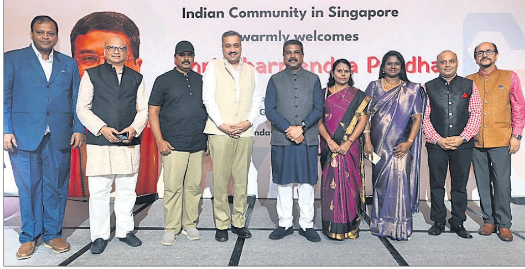
ସିଙ୍ଗାପୁରରେ ପ୍ରବାସୀ ଭାରତୀୟଙ୍କ ସହ କେନ୍ଦ୍ର ଶିକ୍ଷାମନ୍ତ୍ରୀ ଧର୍ମେନ୍ଦ୍ର ପ୍ରଧାନ।