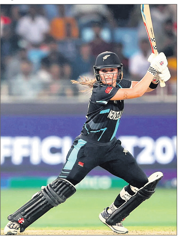
ପ୍ଲେୟର୍ ଅଫ୍ ଦି ମ୍ୟାଚ୍ ଓ ସିରିଜ୍ ଆମେଲିଆ କେର୍ ।

ସାମିତ ରହିଥିଲା । ଟ୍ୱେଣ୍ଟି ଦକ୍ଷିଣ ଆଫ୍ରିକା ପ୍ରଥମ ବୋଲି କରିଥିଲା । କ୍ୟାରିୟରର ୩୩୪ ତମ ଅନ୍ତର୍ଗତୀୟ ମ୍ୟାଚ୍ ଖେଳିଥିବା ସୁଜିତ୍ ଦେବୁ ୩୨ ରନ୍ କରିଥିଲେ । ସେ ଟ୍ୱେଣ୍ଟି ଫୋର ଆମେଲିଆ କେର୍ (୪୩)ଙ୍କ ସହ ୩୬ ରନ୍ ଯୋଡ଼ିଥିଲେ । ୩୧ ବଲ୍ ଖେଳି ସେ ୩ ଚୋକା ମାରିଥିଲେ । ପରେ ଆମେଲିଆ କେର୍ ଓ ବ୍ରୁକ୍ ହାଲିଡେ (୩୮)ଙ୍କ ମଧ୍ୟରେ ୫୭ ରନ୍ର ପାର୍ଟନରଶିପ୍ ହୋଇଥିଲା । ୧୯ ତମ ଓଭରରେ ଆଉଟ ହେବା ଆଗରୁ ଆମେଲିଆ ୩୮ ବଲ୍ ଖେଳି ୪ ଚୋକା ମାରିଥିଲେ । ଅନ୍ୟ ପକ୍ଷରେ ମଧ୍ୟକ୍ରମରେ ବ୍ୟାଟି କରିଥିବା ବ୍ରୁକ୍ ହାଲିଡେ ୨୮ ବଲ୍ ଖେଳି ୩ ଚୋକା ସହ ୩୮ ରନ୍ କରିଥିଲେ । ଦକ୍ଷିଣ ଆଫ୍ରିକା ପକ୍ଷରୁ