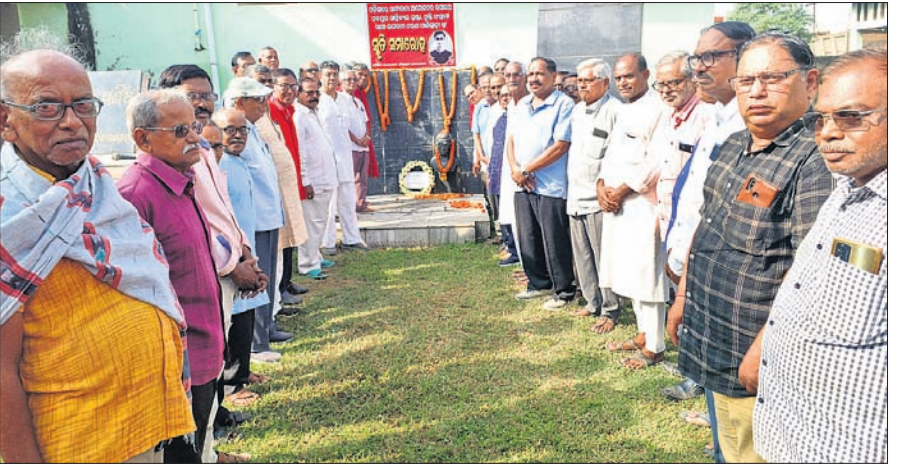
ସାଧୀନତା ସଂଗ୍ରାମୀ ଭଗବତୀ ଚରଣ ପାଣିଗ୍ରାହୀଙ୍କ ୮୧ତମ ରାଜ୍ୟସ୍ତରୀୟ ସ୍ମୃତି ସମାରୋହ ଅବସରରେ ରୂପସାର କଟକ ସତୀତପୁରୀ ଶ୍ରଦ୍ଧାଞ୍ଜଳି ଅର୍ପଣ କରୁଥିବା ବ୍ୟକ୍ତିବୃନ୍ଦ।