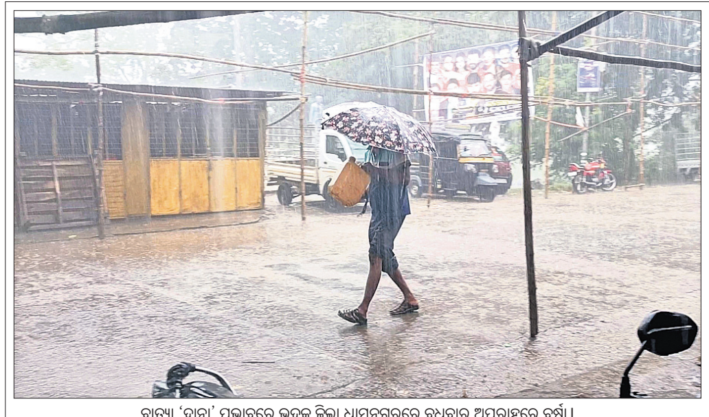
ବାତ୍ୟା 'ଦାନା' ପ୍ରଭାବରେ ଭଦ୍ରକ ଜିଲ୍ଲା ଧାମନଗରରେ ବୁଧବାର ଅପରାହ୍ଣରେ ବର୍ଷା।