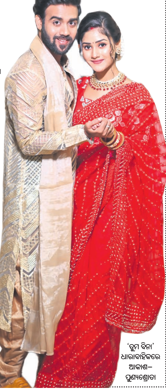
‘ତୁମ ବିନା’ ଧାରାବାହିକରେ ଆକାଶ-ପୁଣ୍ୟଶ୍ରୋତା

ଓଡ଼ିଶାର ଘରେ ଘରେ ପରିଚିତ ‘କା ସାର୍ଥକ’ ଚ୍ୟାନେଲ ସବୁବେଳେ ଲୋକଙ୍କ ପସନ୍ଦକୁ ସୁରୁତ୍ୱ ଦେଇ ଆସିଛି। ଓଡ଼ିଆ ଘରର ପରମ୍ପରା ଓ ରୀତିନୀତିକୁ ନେଇ ଅନେକ ଦର୍ଶକାଦୃତ ଧାରାବାହିକ ଦର୍ଶକଙ୍କୁ ଭେଟି ଦେଇଚାଲିଛି ଏହି ଚ୍ୟାନେଲ। ଜା ସାର୍ଥକର ଏହି ସୂତାରେ ଅନନ୍ତମ ଲୋକପ୍ରିୟ ଧାରାବାହିକ ‘ତୁମ ବିନା’ ସାମିଲ ହୋଇସାରିଛି। ଖୁବ୍ କମ୍ ଦିନରେ ଅକସ୍ମ ପ୍ରଶଂସା ସାଉଁଟିବାରେ ସକ୍ଷମ ହୋଇଛି ଏହି ଧାରାବାହିକ। ‘ତୁମ ବିନା’ରେ ଦର୍ଶକେ ଅକ୍ଷୟ ଓ ଲକ୍ଷ୍ମୀଙ୍କ ଯୋଡ଼ିକୁ ଖୁବ୍ ଭଲପାଇବା ଦେଇଛନ୍ତି। ଗତିଶୀଳ କାହାଣୀ ଅନୁସାରେ ବାହାଘର ପରେ ଉଭୟଙ୍କ ଜୀବନରେ ଅନେକ ଗୋଟକ ମୋଡ଼ ଆସିଛି କିନ୍ତୁ ସବୁକୁ ସାହସର ସହ ସାମ୍ନା କରିଛନ୍ତି ଉଭୟେ। ବର୍ତ୍ତମାନ ତାଙ୍କ ଜୀବନରେ କାଳ ହୋଇ ଉଭା ହୋଇଛି ବିନା। ବାହାଘର ପରେ ବିଚା ଚକ୍ରାନ୍ତରେ ପଡ଼ି ଲକ୍ଷ୍ମୀ ଅନୁରାଧାର ସମ୍ମୁଖୀନ ହେବା ସହ ନିଜ ପ୍ରେମକୁ ତ୍ୟାଗ କରିଛି। ତେବେ ଆସୁଥିବା ‘ତୁମ ବିନା’ ଧାରାବାହିକରେ ଦର୍ଶକେ ଲକ୍ଷ୍ମୀଙ୍କ ସଂଘର୍ଷକୁ ଦେଖିବାକୁ ପାଇବେ। ନିଜ ବୈବାହିକ ଜୀବନକୁ ଦକ୍ଷାଭାଗ ପାଇଁ ଲକ୍ଷ୍ମୀ କ’ଣ କରିବେ ? ବିଚାର ଚକ୍ରାନ୍ତକୁ କେମିତି ମୁକୁଳିବେ ? ବିଚା ନା ଲକ୍ଷ୍ମୀ, କିଏ ମାରିବ ବାଜି ? ଏସବୁ ପ୍ରଶ୍ନର ଉତ୍ତର ଜାଣିବାକୁ ତାହୁଁଥିଲେ ନିଶ୍ଚୟ ଦେଖନ୍ତୁ ‘ତୁମ ବିନା’। ଏହାର ପ୍ରସାରଣ ସମୟ ରହିଛି ସନ୍ଧ୍ୟା ୮ଟା (ସୋମବାରରୁ ଶନିବାର)।