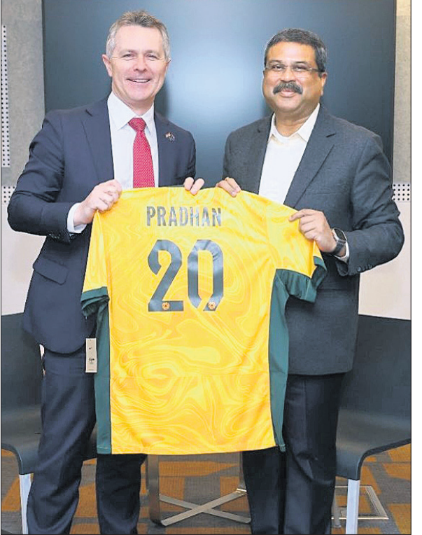
ଅଷ୍ଟ୍ରେଲିଆ ଶିକ୍ଷାମନ୍ତ୍ରୀ କେସନ କ୍ଲେୟାରଙ୍କ ସହ କେନ୍ଦ୍ର ଶିକ୍ଷାମନ୍ତ୍ରୀ ଧର୍ମେନ୍ଦ୍ର ପ୍ରଧାନ।

ଭାରତ ଓ ଅଷ୍ଟ୍ରେଲିଆର ମିଳିତ ସହଯୋଗ ୨ ଦେଶର ଜ୍ଞାନ ବ୍ୟବସ୍ଥାକୁ ଆଗକୁ ନେବା ବିଶ୍ୱ ଆହ୍ୱାନର ସମାଧାନ ପାଇଁ ଜ୍ଞାନକୌଶଳର ଉପଯୋଗ କରିପାରିବ। ଛାତ୍ରାଛାତ୍ରୀଙ୍କୁ ପାଇଁ ଇନୋଭେଟିଭ ଏବଂ ଉଦ୍ୟମିତା କ୍ଷେତ୍ରରେ ପର୍ଯ୍ୟାପ୍ତ ସୁଯୋଗ ସୃଷ୍ଟି କରିପାରିବ। ବିଶ୍ୱ-ବନ୍ଧୁ ହିସାବରେ ଭାରତ ମାନବ କେନ୍ଦ୍ରୀତ ବିକାଶରେ ବିଶ୍ୱସ୍ତ ଅଂଶଦାତା ହେବାକୁ ପ୍ରତିଶ୍ରୁତିବଦ୍ଧ ବୋଲି ଅଷ୍ଟ୍ରେଲିଆର ମେଲବୋର୍ନଠାରେ ଆୟୋଜିତ ‘ଅଷ୍ଟ୍ରେଲିଆ ଅନ୍ତର୍ଜାତୀୟ ଶିକ୍ଷା ସମ୍ମିଳନୀ’ରେ ଯୋଗଦେଇ କେନ୍ଦ୍ରମନ୍ତ୍ରୀ ଧର୍ମେନ୍ଦ୍ର ପ୍ରଧାନ କହିଛନ୍ତି। ଏହି ଅବସରରେ ଧର୍ମେନ୍ଦ୍ର ଅଷ୍ଟ୍ରେଲିଆ ଶିକ୍ଷାମନ୍ତ୍ରୀ କେସନ କ୍ଲେୟାରଙ୍କ ସହ ଦ୍ୱିପାକ୍ଷିକ ବୈଠକ କରିଛନ୍ତି। ଭାରତ ଓ ଅଷ୍ଟ୍ରେଲିଆ ମଧ୍ୟରେ ସୁଦୃଢ଼ ଏବଂ ବିକଶିତ ଭାଗାବାରକୁ ପ୍ରଶଂସାକରି ସେ କହିଛନ୍ତି, ଏହି ଦ୍ୱିପାକ୍ଷିକ ସହଯୋଗ ଉଭୟ ଦେଶର ଉତ୍କଳ ଭବିଷ୍ୟତ ପାଇଁ ମାର୍ଗ ପ୍ରଶସ୍ତ କରିବ। ଚତୁର୍ଥ ଶିକ୍ଷା ବିପ୍ଳବରେ ଏପରି ଶିକ୍ଷା ହେବା ଆବଶ୍ୟକ, ଯେଉଁ ଶିକ୍ଷା ଛାତ୍ରାଛାତ୍ରୀଙ୍କୁ ପ୍ରଯୁକ୍ତିବିଦ୍ୟାର ସୃଷ୍ଟିକର୍ତ୍ତା ଏବଂ ପରିଚାଳକ ହେବା ପାଇଁ ପ୍ରସ୍ତୁତ କରିବ। ଭାରତର ଜାତୀୟ ଶିକ୍ଷାମନ୍ତ୍ରୀ ପରିବର୍ତ୍ତିତ ଚାରିବି ବର୍ଷର ସହ ଯୋଡ଼ିହେବା ପାଇଁ ଡିଜିଟାଲ ସାକ୍ଷରତା, ସଫ୍ଟ ସ୍କିଲ୍, କୃତିକାଳ ପୂର୍ଣ୍ଣ ଏବଂ ଇଣ୍ଟରଡିସିପ୍ଲିନାରି ଷ୍ଟ୍ରକ୍ଚର ଉପରେ