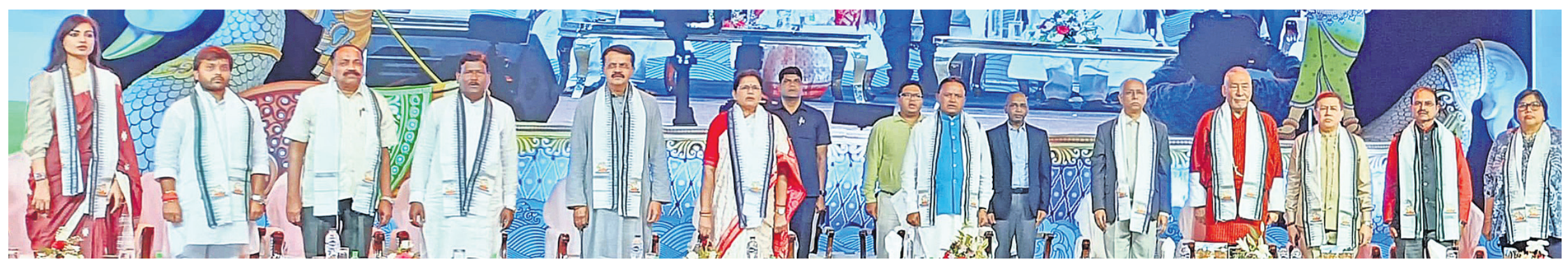
କଟକ ବାଲିଯାତ୍ରାର ଉଦ୍ଘାଟନା କାର୍ଯ୍ୟକ୍ରମରେ ଉପସ୍ଥିତ ମୁଖ୍ୟମନ୍ତ୍ରୀ ମୋହନ ଚରଣ ମାଝୀ, ଉପମୁଖ୍ୟମନ୍ତ୍ରୀ ପ୍ରଭାତୀ ପରିଡ଼ାଙ୍କ ସମେତ ଅତିଥିମାନେ ।