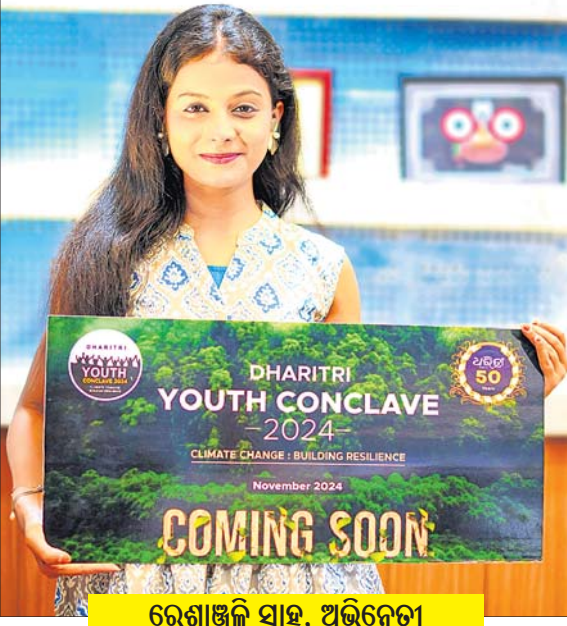
ରେଶ୍ମାଞ୍ଜଳି ସାହୁ, ଅଭିନେତ୍ରୀ