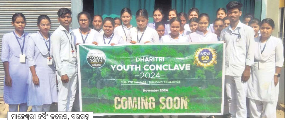
ମାହେଶ୍ଵରୀ ନର୍ସିଂ କଲେଜ, ବରଗଡ଼