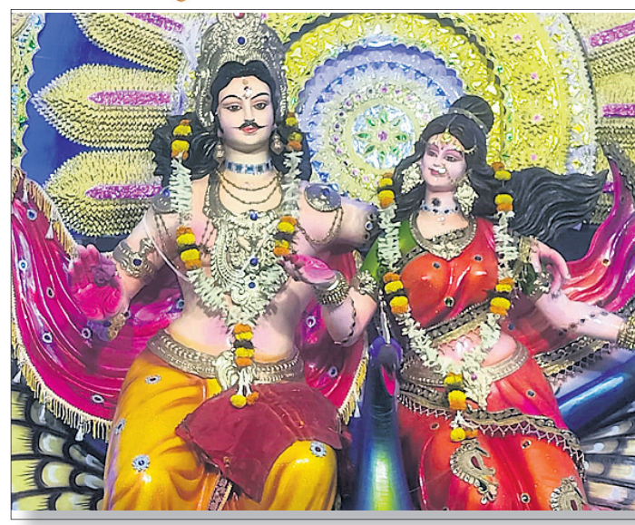
କାରକେଶ୍ୱର ପୂଜା: କଣ୍ଠାପଡ଼ା ବୁକ୍ ଛକ ପୂଜା ମଣ୍ଡପ