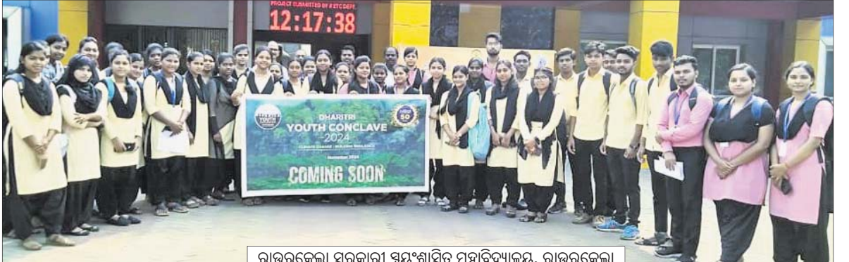
ରାଉରକେଲା ସରକାରୀ ସ୍ଵୟଂଶାସିତ ମହାବିଦ୍ୟାଳୟ, ରାଉରକେଲା