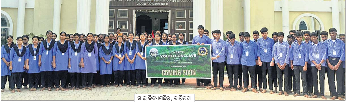
ସାଲ ବିଦ୍ୟାଳୟ, ବାରିପଦା