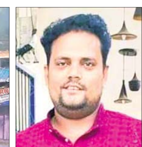
ଦୋକାନରେ ନିଆଁ ଲାଗିଯାଇଥିଲା। ଦୋକାନରେ ନିଆଁ ଲାଗିଥିବା ଦେଖି ଗ୍ଲାନାୟ ଲୋକେ ଅଗ୍ନିଶମ, ବିପୁଲ୍

ଦୋକାନ ଭିତରେ ଫସି ରହିଥିବା ଗୋଟିଏ ଗାଝି ଉଦ୍ଧାର କରିଥିଲେ। ରୁକୁରୁ ଅବସ୍ଥାରେ ଚିକିତ୍ସା ପାଇଁ କଟକ ଗୋଷ୍ଠୀ ସ୍ଵାସ୍ଥ୍ୟକେନ୍ଦ୍ରରେ ଭର୍ତ୍ତି କରାଯାଇଥିଲା। ତାଙ୍କ ସ୍ଵାସ୍ଥ୍ୟବସ୍ଥା ସଙ୍କଟାପନ୍ନ ହେବାରୁ ଭୁବନେଶ୍ଵରର ଗୋଷ୍ଠୀ ସ୍ଵାସ୍ଥ୍ୟକେନ୍ଦ୍ରରେ ଭର୍ତ୍ତି କରାଯାଇଥିଲା। ଏଠାରେ ଚିକିତ୍ସାଧାନ ଅବସ୍ଥାରେ ତାଙ୍କର ମୃତ୍ୟୁ ଘଟିଥିଲା। ତାଙ୍କ ମୃତ୍ୟୁ ଖବର ପ୍ରଚାରିତ ହେବା