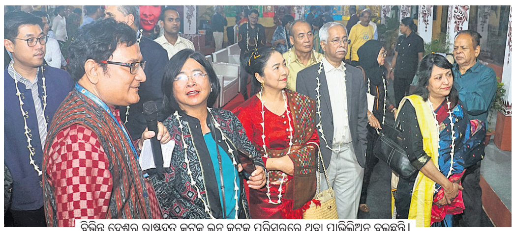
ବିଭିନ୍ନ ଦେଶର ରାଷ୍ଟ୍ରପୂତ କଟକ ଜନ୍ମ କଟକ ପରିସରରେ ଥିବା ପାଠିକିଆନ ବୁଲୁଛନ୍ତି ।

କଟକ, ୧୫୧୧ (ଶିଳ୍ପା ପ୍ରିୟଦର୍ଶିନୀ) କାର୍ତ୍ତିକ ପୂର୍ଣ୍ଣିମା ଅବସରରେ ଶୁକ୍ରବାର ଆରମ୍ଭ ହୋଇଛି କଟକ ବାଲିଯାତ୍ରା । ପ୍ରଥମ ଦିନରେ ବାଲିଯାତ୍ରା ପଡ଼ିଆକୁ ବାହାରିଲେ ଲୋକ ମାଲମାଲ । ବିଶେଷକରି ସନ୍ଧ୍ୟାରେ ଭିଡ଼ ଅଧିକ ଦେଖିବାକୁ ମିଳିଥିଲା । ଚଳିତବର୍ଷ ବାଲିଯାତ୍ରାର ଉପର ଓ ତଳପଡ଼ିଆରେ ପ୍ରାୟ ୨୫୦୦ ଷ୍ଟାଲ ଏବଂ ଓଡ଼ିମାସ୍କର ୫୦୦ ଷ୍ଟାଲ ଖୋଲିଛି । ବାଲିଯାତ୍ରାରେ ବ୍ୟବସାୟ କରିବା ପାଇଁ ବିଭିନ୍ନ ସ୍ଥାନରୁ ବ୍ୟବସାୟୀ ଆସିଛନ୍ତି । ଲୋକମାନେ ଚନ୍ଦ୍ରପତି ଖାଦ୍ୟ ଖାଇବା ସହ ବୁଲାବୁଲି ଓ କିଣାକିଣି କରିଥିଲେ । ଅପରପକ୍ଷରେ କଟକ ଜନ୍ମ କଟକରେ ଓଡ଼ିଆ ଚଳଚ୍ଚିତ୍ର ପାଠିକିଆନ କରାଯାଇଥିବାବେଳେ ଲୋକଙ୍କ ଭିଡ଼ ପରିଲକ୍ଷିତ ହୋଇଛି । ବାଲିଯାତ୍ରା ପାଇଁ ପୁରୀରୁ ବ୍ୟବସାୟ କରୁଥିବା ଲୋକମାନେ ହଜିଯିବାର ସମ୍ଭାବନା ରହିଛି । ସେମାନଙ୍କୁ ନେଇ ଆସିଥିବା ଅଭିଭାବକ ଏଥିପ୍ରତି ଦୃଷ୍ଟି ଦେବାକୁ ପୋଲିସ୍ ନିବେଦନ କରିଛି । ସେହିପରି ଗ୍ରାମିକ ନିୟନ୍ତ୍ରଣ ପାଇଁ ମଧ୍ୟ ସ୍ୱତନ୍ତ୍ର ବ୍ୟବସ୍ଥା କରାଯାଇଛି ।