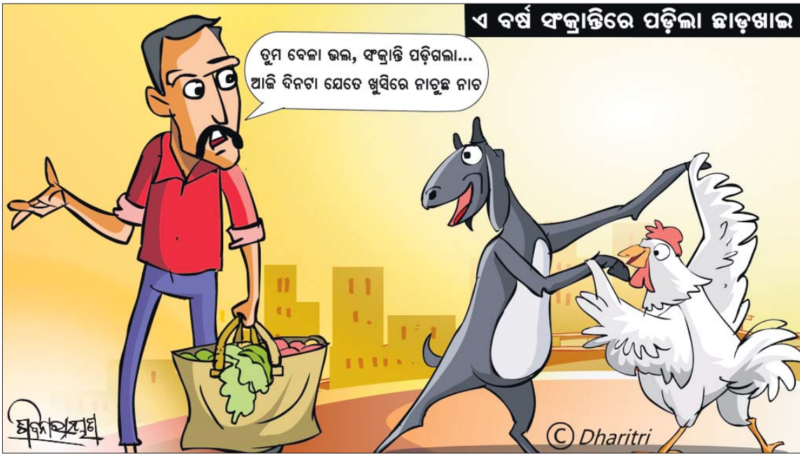
ଏ ବର୍ଷ ସଂକ୍ରାନ୍ତିରେ ପଢ଼ିଲା ଛାଡ଼ଖାଉ