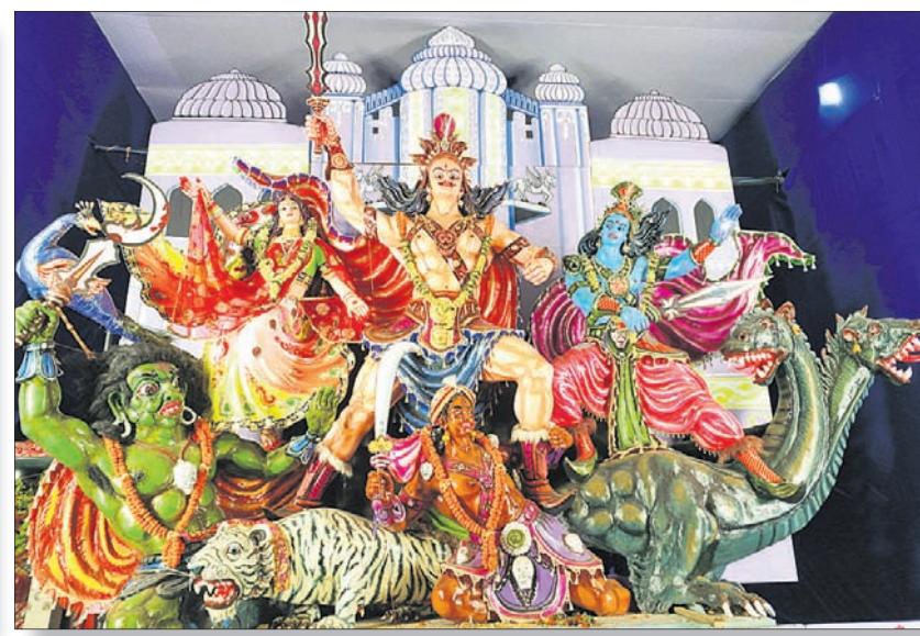
କଟକ ଚାନ୍ଦନୀଗୋଳ ଦଳ ସାହ ପୂଜା କମଳ