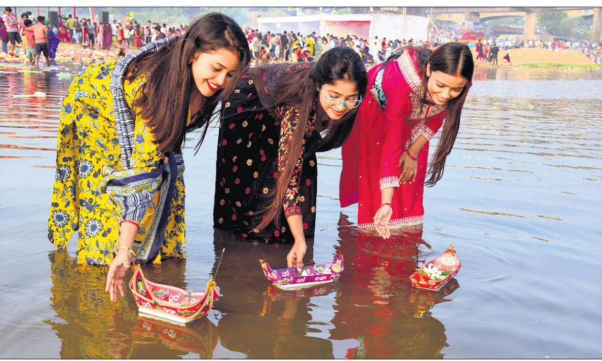
କାର୍ତ୍ତିକ ପୂର୍ଣ୍ଣିମା ଅବସରରେ ଶୁକ୍ରବାର ଭୋର ସମୟରେ ଭୁବନେଶ୍ୱର କୁଆଖାଇ ବ୍ରିଜ ନିକଟ ନଦୀରେ ମହିଳାମାନେ ତଙ୍ଗା ଭସାଇ ଉତ୍କଳୀୟ ନୌବାଣିଜ୍ୟ ପରମ୍ପରାର ସ୍ମୃତିଚାରଣ କରୁଛନ୍ତି।

ମୁଖ୍ୟମନ୍ତ୍ରୀ କହିଛନ୍ତି, ସାଧବ ପୁଅମାନେ ୭ ଦରିଆ, ୧୩ ନଈ ପାର ହୋଇ ଜାଭା, ସୁମାତ୍ରା, ବାଲି, ମାଲେସିଆ ଆଦିକୁ ବେପାର କରିବାକୁ ଯାଉଥିଲେ। ସେମାନେ କେବଳ ବେପାର କରୁ ନ ଥିଲେ, ବରଂ ଓଡ଼ିଶାର ସଂସ୍କୃତିକୁ ସେଠାରେ ପ୍ରସାର କରୁଥିଲେ ଯାହା ଏବେ ବି କରୁଛନ୍ତି। ସେମାନେ ଦେଖିବାକୁ ମିଳୁଛି। ଏହି ଅବସରରେ ମୁଖ୍ୟମନ୍ତ୍ରୀ ଏକ ବଡ଼ ଘୋଷଣା କରି କହିଲେ, ସାବରମତୀ ଢାଆଁରେ ମହାନଦୀରେ ରିଭର ଫ୍ରଣ୍ଟ ହେବ। ସମ୍ଭଳପୁର ଓ କଟକରେ ଏହି ରିଭରଫ୍ରଣ୍ଟ କରିବା ପାଇଁ ୫୦ କୋଟି ଟଙ୍କା ବ୍ୟୟବରାଦ ହୋଇସାରିଛି। ଆହୁରି ୧୫୦ କୋଟି ଟଙ୍କା ପୁଷ୍ଟା-୧୦