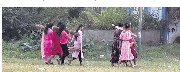
ଛାତ୍ରୀମାନେ କାଠ ନେଇ ଛାତ୍ରୀ ନିବାସକୁ ଯାଇଛନ୍ତି।

ଅନୁରୋଧ କିମ୍ବା ଆଠମଲିକ ବୁକ ପାଲକସାହି ରାଧାମାଧବ ହାଇସ୍କୁଲ ଏସ୍‌ସିଏସ୍‌ଟି ଛାତ୍ରୀ ନିବାସର ଛାତ୍ରୀଙ୍କ ଦ୍ଵାରା ରୋଷେଇ ପାଇଁ କାଠ ବୁହାଯାଇଥିବା ଅଭିଯୋଗ ହୋଇଛି। ଗତ ରୁକୁରା ଶିଶୁ ଦିବସ ଅବସରରେ ପ୍ରଧାନ ଶିକ୍ଷକଙ୍କ ନିର୍ଦ୍ଦେଶରେ ଛାତ୍ରୀମାନେ ନିକଟସ୍ଥ ପଡ଼ିଆକୁ ଛାତ୍ରୀ ନିବାସକୁ କାଠ ଆଣିଥିବା ଅଞ୍ଚଳବାସୀ ଦେଖିବା ପରେ ଗ୍ରାମରେ ଅସନ୍ତୋଷ ବ୍ୟାପିଯାଇଛି। ଏ ନେଇ ଅଞ୍ଚଳବାସୀଙ୍କ ପକ୍ଷରୁ ଶୁଭକାରୀ ଲିଜାପାଳଙ୍କ ନିକଟରେ ଅଭିଯୋଗ କରାଯାଇଛି। ଏଥିସହ ଅଭିଯୋଗର ନକଲ ରାଜ୍ୟ ମୁଖ୍ୟମନ୍ତ୍ରୀ, ଗଣଶିକ୍ଷା ମନ୍ତ୍ରୀଙ୍କ ନିକଟରେ ପଠାଯାଇଛି। ଅଭିଯୋଗରେ ଅଞ୍ଚଳବାସୀ ଦର୍ଶାଇଛନ୍ତି, ଉକ୍ତ ଛାତ୍ରୀ ନିବାସରେ ୨୦୦ ଛାତ୍ରୀ ରହି ପାଲକସାହି