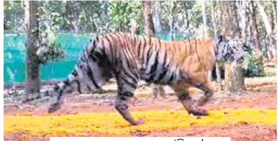
ଏନ୍‌କ୍ଲୋଜରରେ ବୁଲୁଥିବା ‘ଜିନର୍’ ।

ମହାରାଷ୍ଟ୍ର ମୟୂରଭଞ୍ଜ ଜିଲ୍ଲା ଶିଳିପାଳ ବ୍ୟାପ୍ତ ସଂରକ୍ଷଣ ପ୍ରକଳ୍ପକୁ ଅଣାଯାଇଥିବା ଅନ୍ୟ ଏକ ମହାବଳ ବାଲୁଣୀକୁ ଏନ୍‌କ୍ଲୋଜରରେ ଛଡ଼ାଯାଇଛି। ସ୍ତ୍ରୁ ଓ ଚଳଚ୍ଚିତ୍ର ଭାବେ ସେ ଏନ୍‌କ୍ଲୋଜରରେ ବୁଲୁଥିବା ବେଳେ ତା’ର ନାମ ରଖା ବଦଳରେ ‘ଜିନର୍’ ରଖାଯାଇଛି। ଏହି ବାଲୁଣୀର ଗତିବିଧି ଉପରେ ସ୍ୱତନ୍ତ୍ର ଚାଲିନାପ୍ରାପ୍ତ ଚିମ୍ ନକର ରଖିଛନ୍ତି। ସ୍ୱତନ୍ତ୍ର ଗାଡ଼ି ଯୋଗେ ସୁନ୍ଦର ରାସ୍ତା ଅତିକ୍ରମ କରି ମହାବଳ ବାଲୁଣୀକୁ ଆଣି ଶିଳିପାଳରେ ଛାଡ଼ିବା ପରେ ପ୍ରଧାନ ମୁଖ୍ୟ ବନ୍ୟପ୍ରାଣୀ ସଂରକ୍ଷକ ସୁଶାନ୍ତ