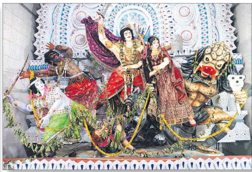
ଛତ୍ର ବଜାର ପୂଜା କମଳ