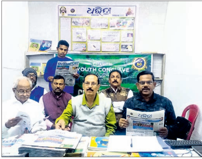
ଧରିତ୍ରୀ ସ୍ୱଳ୍ପରେ ପରିବର୍ତ୍ତନ କରିବାକୁ ଆସିଥିବା ବିଶିଷ୍ଟ ବ୍ୟକ୍ତିମାନେ ।

ଉତ୍ତର, ୧୭।୧୧ (ସମାଜର ରାଉତ) ଉତ୍ତର ପୁସ୍ତକ ମେଳାରେ ଷ୍ଟଲ୍ ପରିବର୍ତ୍ତନ ସତ୍ୟ ଓ ତଥ୍ୟଭିତ୍ତିକ ଖବର ପରିବେଷଣ କରିବାରେ ଧରିତ୍ରୀ ଖବରକାଗଜ ଗୁରୁତ୍ୱ ଦେଉଛି ବୋଲି ୨୪ତମ ଉତ୍ତର ପୁସ୍ତକ ମେଳାର ତୃତୀୟ ସମ୍ପର୍କରେ ଉଦ୍‌ଘାଟନ କରୁଥିବା ଧରିତ୍ରୀର ରାଜ୍ୟ ସ୍ୱଳ୍ପ ପରିବର୍ତ୍ତନ କରିବା ଅବସରରେ କହିଛନ୍ତି।