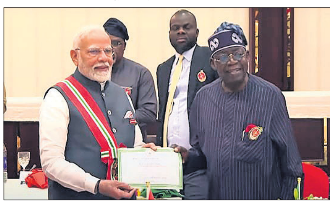
ନାଲକେରିଆ ରାଷ୍ଟ୍ରପତି ବୋଲା ଅହମଦ୍ ତିରୁରୁ ରବିବାର ପ୍ରଧାନମନ୍ତ୍ରୀ ନରେନ୍ଦ୍ର ମୋଦିଙ୍କୁ 'ଗ୍ରାଣ୍ଡ କମାଣ୍ଡର ଅଫ୍ ଦି ଅର୍ଡର ଅଫ୍ ଦି ନାଲକର' ସମ୍ମାନ ପ୍ରଦାନ କରୁଛନ୍ତି।