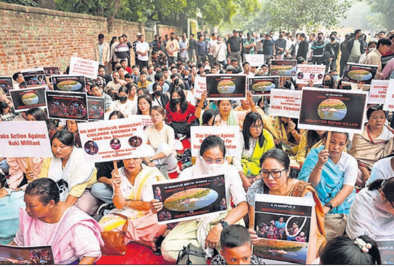
ମଣିପୁରରେ ହିଂସା ଲାଗି ରହିଥିବାବେଳେ ଇମ୍ଫାଲରେ ଗାୟାର ଜାଲି ବିସୋଧ ପ୍ରଦର୍ଶନ କରାଯାଇଛି।