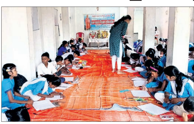
ପ୍ରତିଯୋଗୀମାନେ ଚିତ୍ରାଙ୍କନ କରୁଛନ୍ତି।

ଉତ୍ତର, ୧୭।୧୧ (ସମାଜର ରାଉତ) ଉତ୍ତର ପ୍ରାଥମିକ ଓ ଉଚ୍ଚ ବିଦ୍ୟାଳୟର ନାୟକ ଉଦ୍‌ଘାଟନ କରୁଛନ୍ତି। ନାୟକ ଉଦ୍‌ଘାଟନ କରୁଛନ୍ତି।