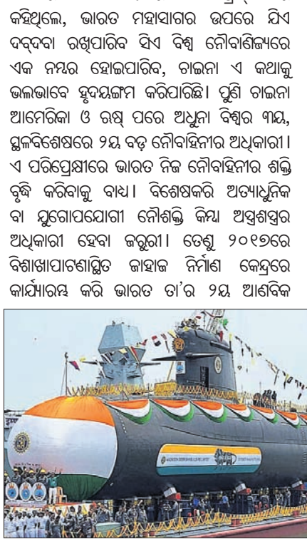
ଭାରତୀୟ ସାମୁଦ୍ରିକ ଶକ୍ତିର ଉତ୍ଥାନ।

ଆମେରିକା ନୌବାହିନୀର ଆଲଗେସ୍ ଥର କହିଥିଲେ, ଭାରତ ମହାସାଗରର ଉପରେ ଯିଏ ବଦଳିବା ରଖିପାରିବ ସିଏ ବିଶ୍ୱ ନୌବାହିନୀରେ ଏକ ନୟନ ହୋଇପାରିବ, ଚାନ୍ଦନୀ ଏ କଥାକୁ ଭଲଭାବେ ବୁଝାଇବାକୁ କରିପାରିବେ। ପୂର୍ଣ୍ଣ ଚାନ୍ଦନୀ ଆମେରିକା ଓ ରକ୍ଷ ପରେ ଅଧୁନା ବିଶ୍ୱର ମାୟ, ଗୁଲ୍ ଦିଗରେ ଯିବ ବଡ଼ ନୌବାହିନୀର ଅଧିକାରୀ।