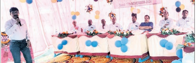
ଧାମନଗର, ୧୭।୧୧ (ବେବେନ୍ସ

ଧାମନଗର, ୧୭।୧୧ (ବେବେନ୍ସ ଅଧିଆ)-ଧାମନଗର ଲୁକ୍ଷେପୁର ହାତୀଙ୍କୁ ପରିବରରେ ୧୯୮୮ ମସିହା ମାସରେ ବନ୍ଧୁମିଳନ ଉତ୍ସବରେ ପ୍ରସ୍ତୁତ ହୋଇଯାଇଛି।