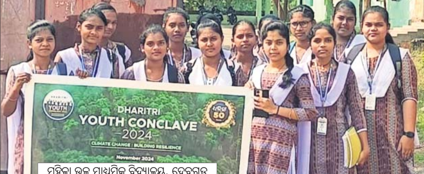
ମହିଳା ଉଚ୍ଚ ମାଧ୍ୟମିକ ବିଦ୍ୟାଳୟ, ଦେବଗଡ଼