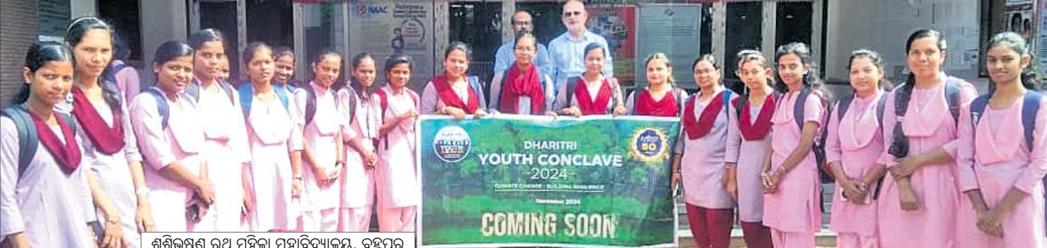
ଶଶିଭୂଷଣ ରଥ ମହିଳା ମହାବିଦ୍ୟାଳୟ, ବ୍ରହ୍ମପୁର