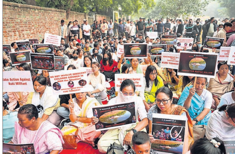
ମଣିପୁରରେ ହିଂସା ଲାଗି ରହିଥିବାବେଳେ ଇଞ୍ଜାଲରେ ଗାୟାର ଜାଲି ବିସୋଧ ପ୍ରଦର୍ଶନ କରାଯାଇଛି।