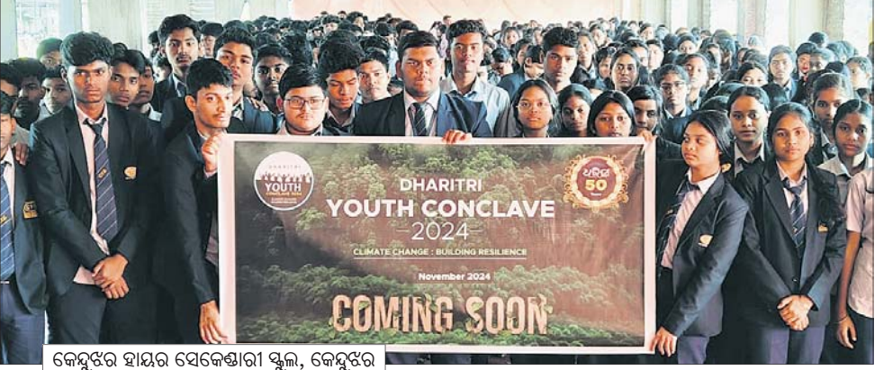
କେନ୍ଦୁଝର ହାଇର ସେକେଣ୍ଡାରୀ ସ୍କୁଲ, କେନ୍ଦୁଝର