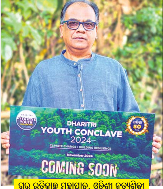
ଗୁରୁ ରତିକାନ୍ତ ମହାପାତ୍ର, ଓଡ଼ିଶା ନୃତ୍ୟଶିଳ୍ପୀ