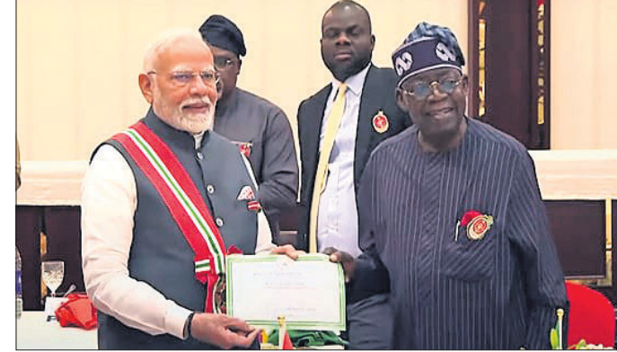
ନାଲଜେରିଆ ରାଷ୍ଟ୍ରପତି ବୋଲି ଅହମଦ୍ ଚିତ୍ତୁର ରବିବାର ପ୍ରଧାନମନ୍ତ୍ରୀ ନରେନ୍ଦ୍ର ମୋଦିଙ୍କୁ 'ଗ୍ରାଣ୍ଡ କମାଣ୍ଡର ଅଫ୍ ଦି ଅର୍ଡର ଅଫ୍ ଦି ନାଇଜର' ସମ୍ମାନ ପ୍ରଦାନ କରୁଛନ୍ତି।

ପ୍ରଧାନମନ୍ତ୍ରୀ ନରେନ୍ଦ୍ର ମୋଦି ରବିବାର ନାଲଜେରିଆର ଦ୍ୱିତୀୟ ସର୍ବୋଚ୍ଚ ରାଷ୍ଟ୍ରୀୟ ସମ୍ମାନ 'ଗ୍ରାଣ୍ଡ କମାଣ୍ଡର ଅଫ୍ ଦି ଅର୍ଡର ଅଫ୍ ଦି ନାଇଜର' ସମ୍ମାନରେ ସମ୍ମାନୀତ ହୋଇଛନ୍ତି।