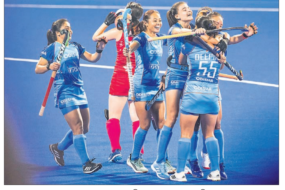
ଗୋଲ ଖୋରପରେ ଉଲ୍‌ସିଟ ଭାରତୀୟ ଦଳର ଖେଳାଳି।

ଷ୍ଟିଲର୍ସ ବିଜୟୀ | ନୂଆଦିଲ୍ଲୀ, ୧୭/୧୧: ପ୍ରୋ କବାଡି ବିପକ୍ଷ ମ୍ୟାଚକୁ ୩୬-୨୯ରେ ଲିଗ୍‌ରେ ରବିବାର ତାମିଲ ଆଲାଇଭ୍‌ସ୍ ବିଜୟୀ ହୋଇଛି ହରିୟାଣା ଷ୍ଟିଲର୍ସ।