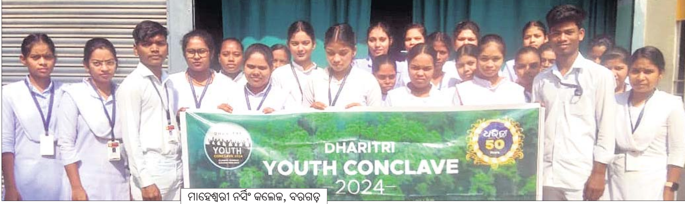
ମାହେଶ୍ଵରୀ ନର୍ସି କଲେଜ, ବରଗଡ଼