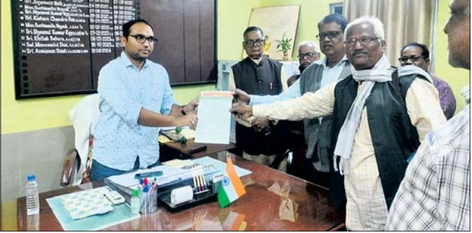
ବିତିଷ୍ଟ ମହାସଂଘର ସଦସ୍ୟମାନେ ପୁଣ୍ୟମନ୍ତ୍ରାଳୟ ଭବନରେ ସ୍ୱାଗତକ୍ରମେ ବେଢ଼ିଲେ।

ବାଙ୍କୀ, ୨୭.୧୧.୨୦୨୪ (ଜ୍ଞାନେନ୍ଦ୍ର ମୋହନ ମିଶ୍ର): ଓଡ଼ିଶା ରାଜ୍ୟ ଅଧିକାରୀଙ୍କୁ କର୍ମଚାରୀ ମହାସଂଘର ଆହ୍ୱାନକ୍ରମେ ବାଙ୍କୀ ଓ ତମପଡ଼ା କୁ ଶାଖାର ବୈଠକ ସ୍ଥାନୀୟ ଶିକ୍ଷକ ଭବନରେ କୋଷିକ ନାୟକଙ୍କ ସଭାପତିତ୍ୱରେ ଅନୁଷ୍ଠିତ ହୋଇଥିଲା।