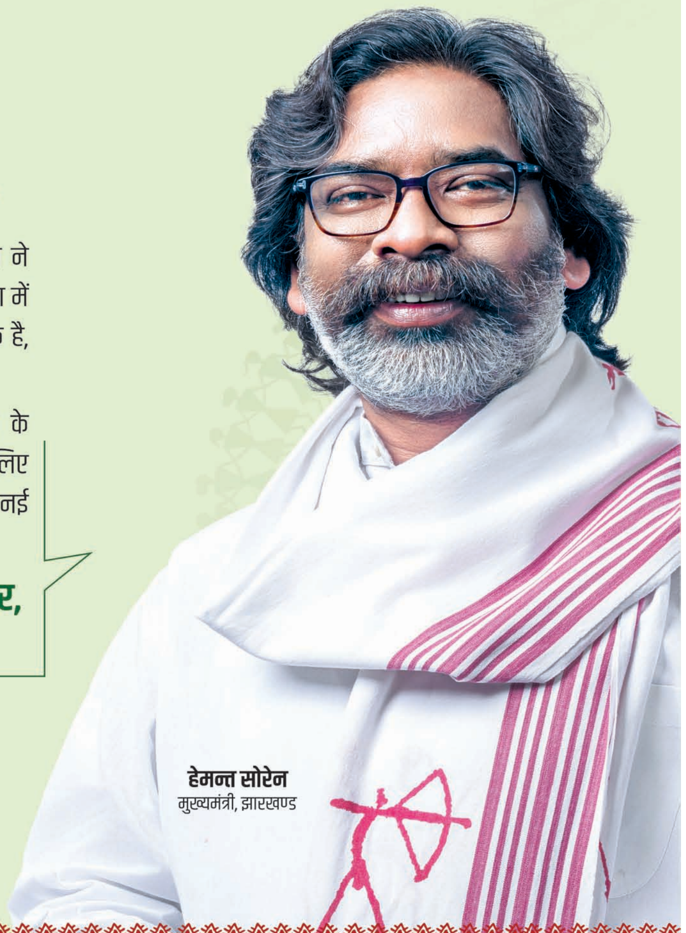
हेमन्त सोरेन मुख्यमंत्री, झारखण्ड