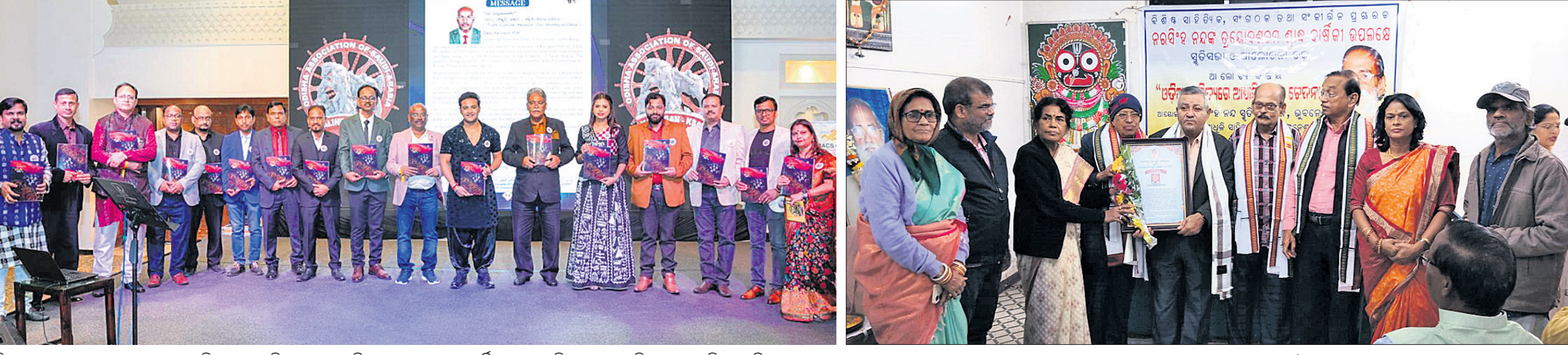
ସାଇତି ଆରବର ବନାମ ସହଯୋଗ ପ୍ରାପ୍ତ ଓଡ଼ିଆ ସାଂସ୍କୃତିକ ଅନୁଷ୍ଠାନ କଳିଙ୍ଗ କେନ୍ଦ୍ରର ୭୧ ବର୍ଷିକ ଉତ୍ସବ ପାଳିତ ହୋଇଯାଇଛି।