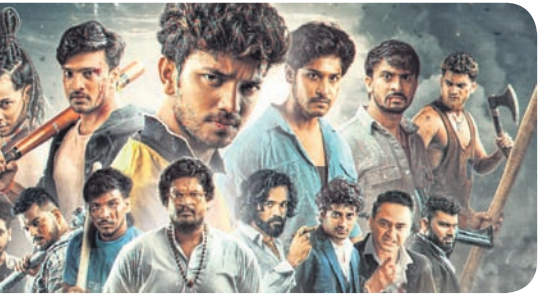
'ଘମାଘୋଟ' ଫିଲ୍ମର ଏକ ଦୃଶ୍ୟ