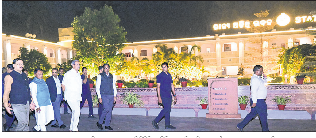
ଭୁବନେଶ୍ୱରରେ ଆୟତ୍ତା ୨୯ରୁ ଆୟୋଜିତ ହେବାକୁ ଥିବା ତିନିଦିନିଆ ତିଳି-ଆଇଡି ସମ୍ମିଳନୀ ପୂର୍ବରୁ ଭୁବନେଶ୍ୱର ଚାକିରି ମାର୍ଗସମ୍ମୁଖୀ ମୋହନ ଚରଣ ମାଣ୍ଡ ପ୍ରଭୃତିର ସମାଧାନ କରୁଛନ୍ତି।

ଭୁବନେଶ୍ୱର, ୨୭।୧୧ (ବନ୍ଦନା ସେଠା) - ଆଉଗ୍ରିପ ପକ୍ଷରୁ ଭୁବନେଶ୍ୱରରେ ଆୟୋଜିତ ହେବ ପ୍ରତିଭା ଆଇଡିଆ ଲଭେଷ ମ୍ୟାଗାଜିନ ପ୍ରତିଯୋଗିତା କର୍ମଶାଳା।