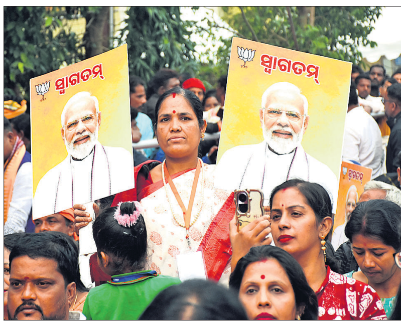
ପ୍ରଧାନମନ୍ତ୍ରୀଙ୍କୁ ସ୍ୱାଗତ କରାଇବା ପାଇଁ ପାରମ୍ପରିକ ନୃତ୍ୟ, ଘୋଡ଼ାଦାତ ସହ ଜନସମାଗମରେ ଜଣେ ମହିଳା ସ୍ୱାଗତମ୍ ପୂର୍ବକ ପ୍ରଦର୍ଶନ କରୁଛନ୍ତି ।