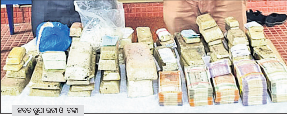
ଜବତ ରୁପା ଜଗା ଓ ଟଙ୍କା

ଜବତ କରିଥିଲା । ଦୁଇ ବ୍ୟବସାୟୀ ତଥା ପଣ୍ଡିମବଜ୍ଜ ପଣ୍ଡିମ ମିଦନାପୁର ଜିଲ୍ଲା ଘଟାଇ ଥାନା ଅନ୍ତର୍ଗତ ନିର୍ଦ୍ଦିମପୁର ଗ୍ରାମର ପ୍ରତାପ ଓ ବୁଦ୍ଧଲି ଜିଲ୍ଲାର ଖନାସ୍କୁଲ ଥାନା ଅନ୍ତର୍ଗତ ଠାକୁରାଣୀ ଚୌକ ଗ୍ରାମର ଅରୁପକ୍ଷ୍ମ ଅଟକ ରଖି ଥାନା ଅଧିକାରୀ ପ୍ରଧାନ ଜିଏସ୍‌ଟି ଅଧିକାରୀଙ୍କୁ ଖବର ଦେଇଥିଲେ । ଶୁକ୍ରବାର ଭୁବନେଶ୍ୱରରୁ ଏକ ମା ଜଣିଆ ଜିଏସ୍‌ଟି ଟମ୍ ଖଲିକୋଟ ଥାନାକୁ ଆସିବା ପରେ ବୁର ବ୍ୟବସାୟୀ ଓ ଜବତ ରୁପାଇଟା, କାର ଓ ଟଙ୍କା ପୋଲିସ ସେମାନଙ୍କୁ ହସ୍ତାନ୍ତର କରିଥିଲା । ଜବତ ହୋଇଥିବା ରୁପା ଜଗର ଆନୁମାନିକ ମଲ୍ୟ ୭୦ ଲକ୍ଷରୁ ଅଧିକ ଟଙ୍କା ହେବ ବୋଲି ଜଣାପଡ଼ିଛି ।