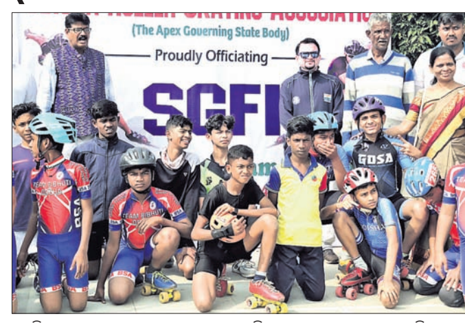
ଅତିଥିକ ସହ ଏସ୍‌ଜେଏଫ୍‌ଆଇ ରୋଲର ଷ୍ଟେଟିଂରେ ଅଂଶଗ୍ରହଣକାରୀ ଖେଳାଳିମାନେ

ସ୍କୁଲ ଗୋପୁ ଫେଡେରେଶନ ଅଫ୍ ଇଣ୍ଡିଆ (ଏସ୍‌ଜେଏଫ୍‌ଆଇ) ରୋଲର ଷ୍ଟେଟିଂ ଚାମ୍ପିୟନଶିପ୍ ପ୍ରଥମଥର ପାଇଁ ଓଡ଼ିଶାରେ ସଫଳତାର ସହ ଆୟୋଜନ ହୋଇଯାଇଛି।