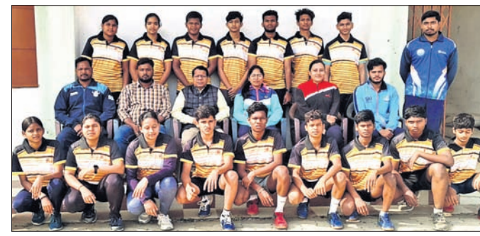
ଜାତୀୟ କ୍ରୀଡ଼ା ଦଳ ଯୋଷିତ ପାଇଁ ଓଡ଼ିଶା ଦଳ ଯୋଷିତ

କରୁଛି। ଅନ୍ୟପକ୍ଷରେ ତିନି ରାଜ୍ୟକୁ ହାତେଇଥିବା ଲିଓ ଷ୍ଟାର ପକ୍ଷରୁ ଏହାକୁ ନେଇ ଅସହମତି ବ୍ୟକ୍ତ କରାଯାଇଛି।