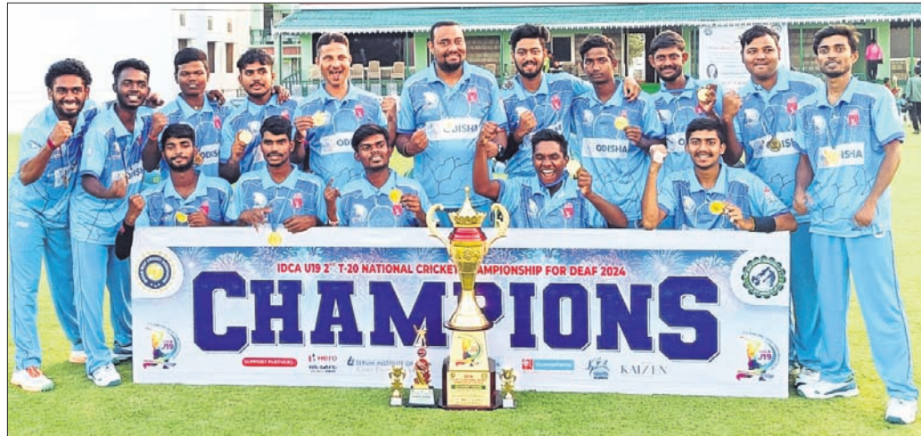
୧୯ ବର୍ଷରୁ କମ୍ ଜାତୀୟ ଓଡ଼ିଶା ଦଳ ଚାମ୍ପିୟନ ଓଡ଼ିଶା ଦଳ

ଭୁବନେଶ୍ୱର, ୨୯/୧୧ (ସରୋଜ ଜେନା): ରାୟପୁରର ଆରମ୍ଭିକ ଗ୍ରାଉଣ୍ଡରେ ଖେଳା ଯାଇଥିବା ୧୫ ବର୍ଷରୁ କମ୍ ବାଳିକା ଜାତୀୟ ଦିନିକିଆ ମ୍ୟାଚ୍ରେ ଖେଳିଥିବା ୧୧୩ ରନ୍ରେ ପରାସ୍ତ କରିଥିବା ଓଡ଼ିଶା ଦଳ ଚାମ୍ପିୟନ ହୋଇଛି।