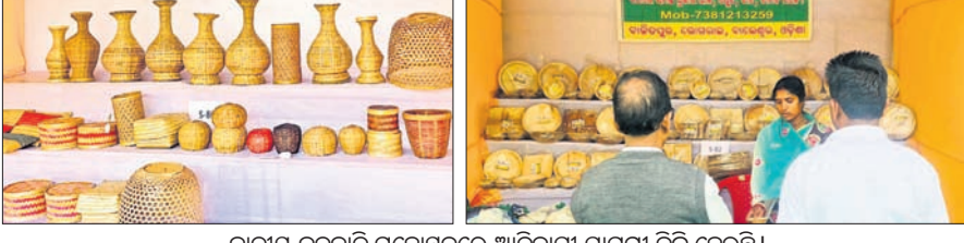
ଜାତୀୟ ଜନଜାତି ମହୋତ୍ସବରେ ଆଦିବାସୀ ସାମଗ୍ରୀ ବିକ୍ରି ହେଉଛି।