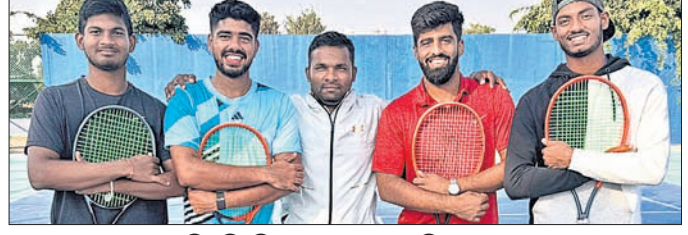
କିର୍ ବିଶ୍ୱବିଦ୍ୟାଳୟ ପୁରୁଷ ଟେନିସ୍ ଦଳ

କାନବେରା, ୨୯/୧୧ (ପି.ଟି.): ବର୍ତ୍ତମାନ-ଗାଭାସ୍ରେ ଟେନିସ୍ ଦଳ ଫାଇନାଲରେ ଓଡ଼ିଶା ଦଳ ଚାମ୍ପିୟନ ହୋଇଛି।